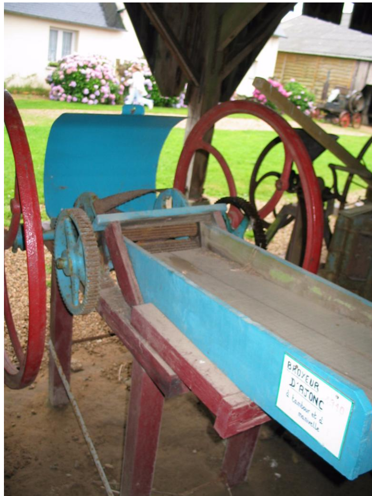
Broyeur d'ajonc, Ferme-musée du Léon

Les outils de transformation des ajoncs en fourrage ont évolué au cours du temps. Le morzoul lann est un marteau en bois renforcé de fer qui servait à hacher l'ajonc dans des auges en pierre il y a bien longtemps. Par la suite on a utilisé des moulins à ajoncs, les Piler lann puis des broyeurs à main ou à moteur dit hache lande ou dralherez lann . Il existait même un manteau en peau de chèvre, ar c'hroc'henn-garv pour aller couper les ajoncs avec la faucille dans les ajonnières, il permettait de transporter les fagots d'ajoncs sans se piquer. Ces outils sont actuellement visibles à la ferme-musée du Léon (Tréflaouéan, Finistère).