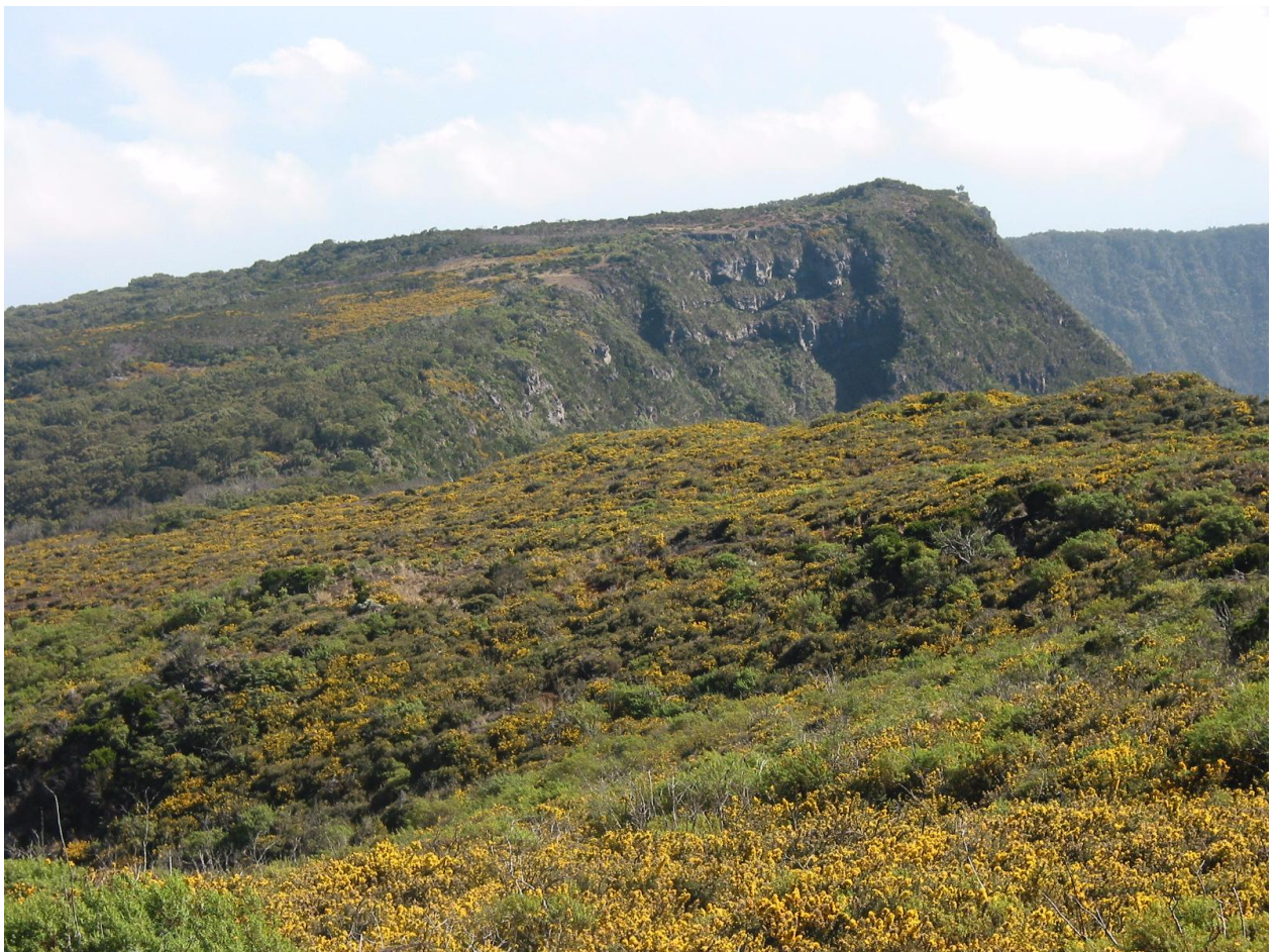
Prolifération d'ajonc sur l'île de la Réunion (Piton Maïdo, août 2004)

L'ONF qui gère les espaces naturels de l'île déploie des moyens importants pour préserver les espèces végétales originelles insulaires de l'ajonc devenu envahissant.