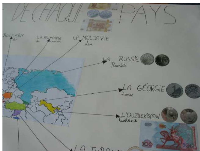
Ill. 5 - Planisphère des monnaies