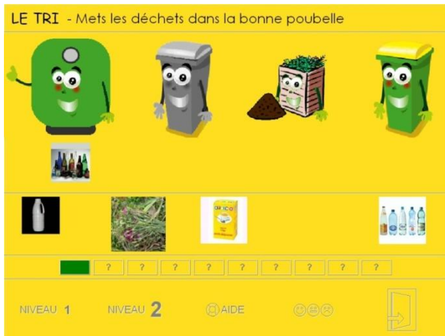
Figure 4. Jeu « la bonne poubelle » dans TRI.

Cinq jeux sont disponibles à partir de l'écran d'accueil. Chaque jeu dispose de deux niveaux de difficulté, d'une aide et d'un système de correction.