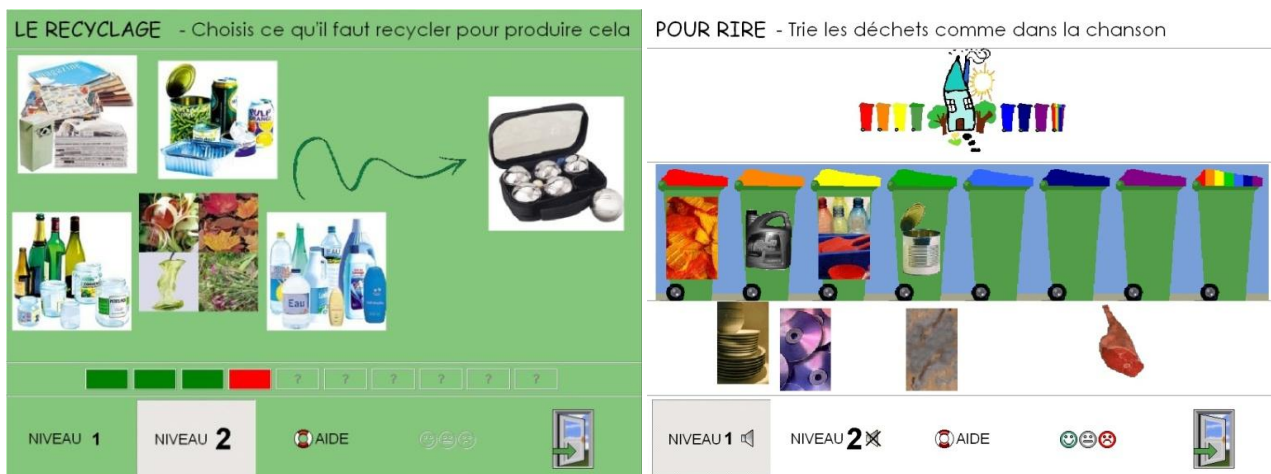
Figure 7. Jeu « recyclage » et jeu « la chanson des poubelles » dans TRI.

Pour le jeu des couleurs des poubelles, l'enfant doit, après avoir identifié leur contenu, peindre chaque poubelle avec les bonnes couleurs. L'aide consiste à mettre en évidence pendant un instant les réponses erronées, correctes et partielles en entourant les poubelles selon un code couleur. Le niveau de difficulté fait varier le nombre d'essais et le nombre de couleurs proposées.