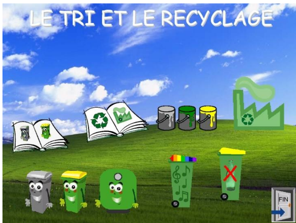
Figure 2. Écran d'accueil et de choix d'activités de TRI.

TRI s'articule autour de son écran d'accueil (cf. Figure 2) qui donne accès aux différents cours et exercices. Le logiciel ciblant les jeunes enfants, l'environnement est entièrement visuel, toutes les consignes et tous les messages sont donnés oralement, même si ces informations sont doublées d'informations textuelles à destination des adultes encadrant l'activité, qui peuvent également servir de repère aux lecteurs.