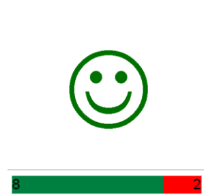
Figure 5. Exemple de bilan d'un jeu dans TRI : 8 bonnes réponses et 2 mauvaises réponses.

poubelle adéquate. Si le déchet est placé dans la bonne poubelle (comme des bouteilles de verre dans le conteneur à verre dans l'exemple de la Figure 4), la poubelle fait un geste de la main, sourit, le déchet est masqué en faisant un bruit (du verre brisé dans cet exemple), la poubelle se régale (« Hum, miam miam miam »), un point est accordé à l'enfant (matérialisé par un rectangle vert dans le bandeau d'évaluation), avant de passer au déchet suivant. Si la poubelle est mal choisie, elle fait la grimace et disant « beurk » : le déchet est rejeté et l'enfant doit recommencer. La partie est terminée quand tous les essais ont été épuisés. L'aide consiste à afficher pendant un instant un exemple de déchet pour chaque poubelle. Le niveau de difficulté fait varier le nombre d'essais, le nombre de poubelles et le nombre de déchets proposés.