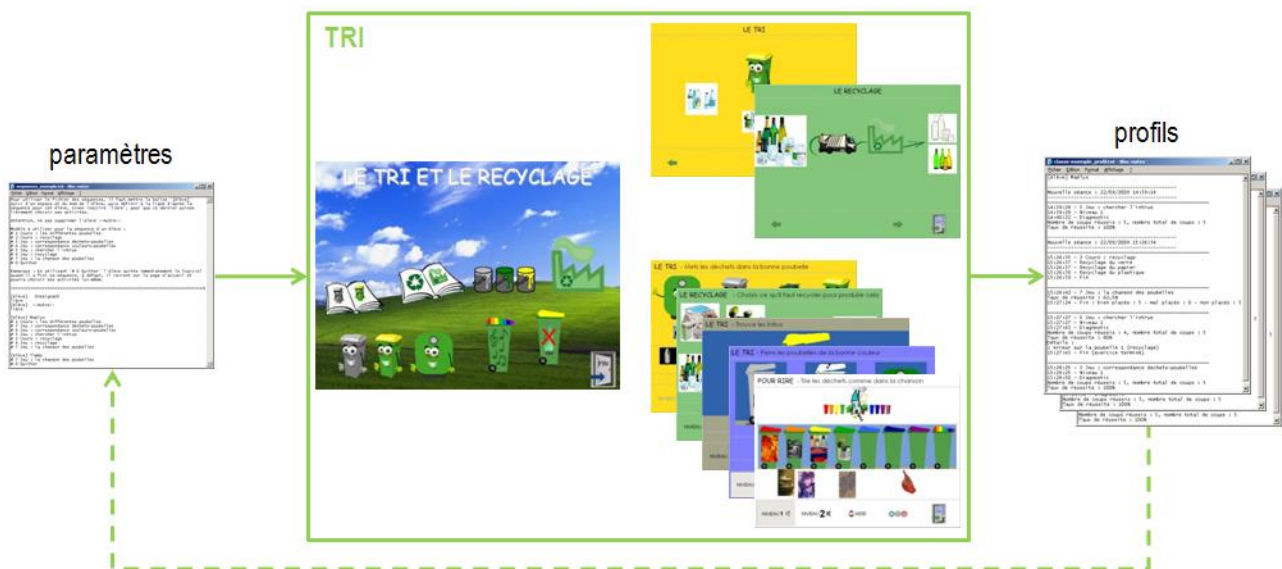
Figure 1. Architecture générale de TRI.