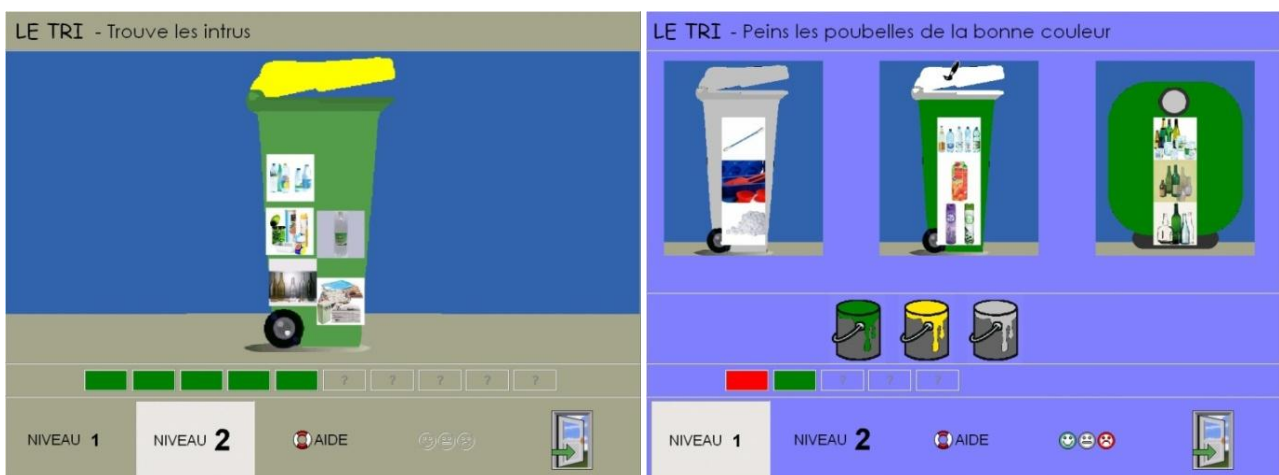
Figure 6. Jeu « l'intrus » et jeu « les couleurs des poubelles » dans TRI.

À la fin de chaque partie, un bilan synthétise la répartition entre bonnes et mauvaises réponses de l'enfant et donne une évaluation globale à l'aide d'un smiley doublé d'un code couleur (cf. Figure 5).