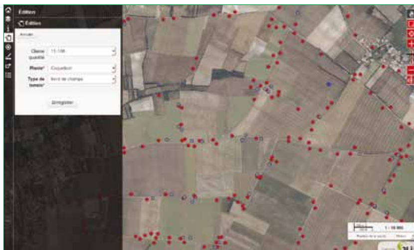
Visualisation et intégration web sur tablette grâce à PostGIS , QGis server et Lizmap .