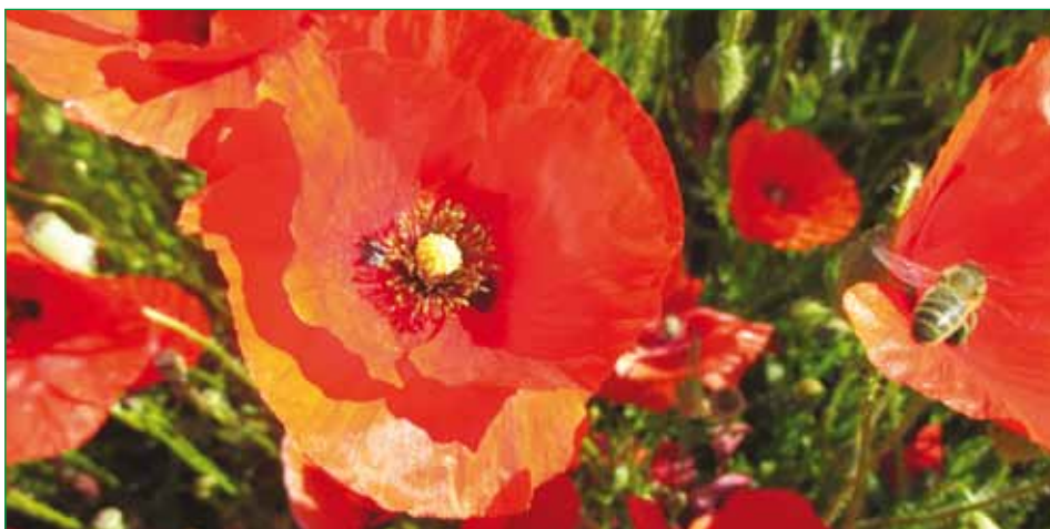
Jusqu'à 80 % des pollens ramenés à la ruche peuvent être issus des coquelicots (Feuillet et al., 2008).

de données, ainsi qu'à un portail cartographique adapté à son besoin. Les utilisateurs sont formés aux méthodes de saisie informatiques et géographiques simples, évitant ainsi la manipulation de logiciels SIG complexes demandant une formation approfondie en géomatique. Les analystes, quant à eux, peuvent utiliser des logiciels comme QGIS ou R en accédant à la base centrale afin de lancer des géo-traitements.