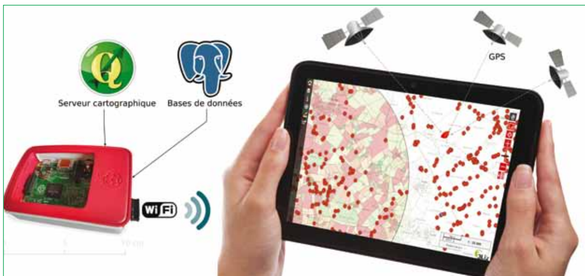
Schéma de fonctionnement de Géo-Poppy .

Côté matériel, il était essentiel de trouver un ordinateur léger et autonome, pouvant se porter facilement sur soi. Pour des raisons de compatibilité, il était également indispensable que l'outil puisse disposer de versions de logiciels similaires au serveur central. Nous avons choisi le Raspberry Pi TM , un nano-ordinateur monocarte de la taille d'une carte de crédit. Cet ordinateur est destiné à encourager l'apprentissage de la programmation informatique. Il permet l'exécution de plusieurs variantes du système d'exploitation GNU/Linux et de logiciels compatibles. Il est fourni nu, carte mère seule, sans boîtier ni alimentation dans l'optique de diminuer les coûts et permettre l'utilisation de matériel de récupération (écran, souris et clavier). Nous avons choisi une batterie externe de 10 000 mAh dont l'encombrement est identique au Raspberry et dont l'autonomie permet plusieurs jours d'utilisation.