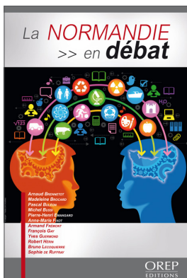
Figure 2. La Normandie en débat , OREP, Bayeux, 2012

La publication de cet ouvrage a eu un écho contrasté. Hormis quelques cas isolés, les responsables institutionnels interpellés ont peu réagi. Cette indifférence politique a largement résulté de l'hostilité de certains leaders socialistes haut-normands d'alors vis-à-vis de toute fusion des deux régions normandes, alors même que cette perspective était mieux accueillie en Basse-Normandie. Cet ouvrage a néanmoins permis de faire connaître les idées développées au sein du collectif, de nouer des contacts et d'engager un dialogue avec divers acteurs du territoire régional, notamment par le biais de réponses à invitations : réunions d'associations citoyennes, tribunes libres dans la presse régionale, réponses à interviews, cafés géographiques, etc. La présentation de l'ouvrage, proche du format académique, n'a cependant pas permis de toucher un large public.