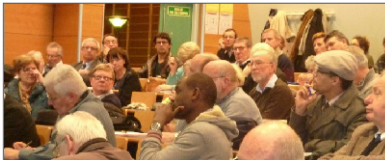
Rencontre avec le public sur le thème de l'identité normande, Rouen, 12 décembre 2014