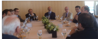
Déjeuner de travail avec le maire du Havre, 11 juin 2015

Dans ce nouveau contexte, outre la préparation des bulletins sur la métropole normande (figure 5), l'animation de rencontres publiques et l'organisation d'un colloque scientifique