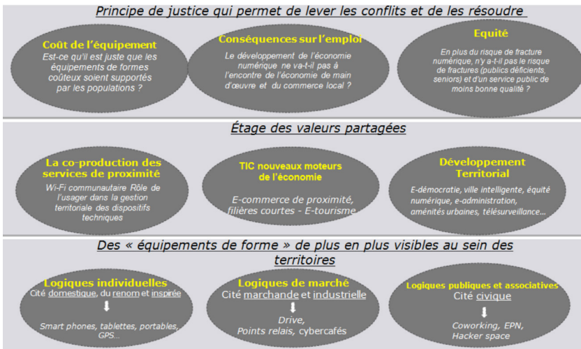
Figure 5. Les trois étages de la « convention Internet » (P. Vidal)

Cet étage est celui qui permet de lever les « conflits de représentation » et de trouver des réponses permettant de les résoudre. C'est l'ensemble des valeurs auxquelles les agents se réfèrent pour juger du bien-fondé d'une action. Cet étage va permettre au principal dépositaire de la convention de surmonter les difficultés qu'entraînent inmanquablement l'adhésion collective à une convention et encore plus l'installation de dispositifs institutionnels aux appropriations multiples. C'est ce principe de justice qui constitue le « fond de présupposé commun ».