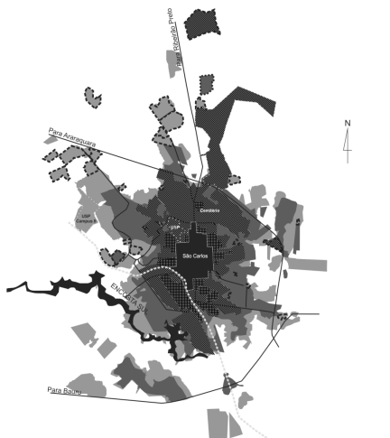
Carte 4. Presidente Prudente