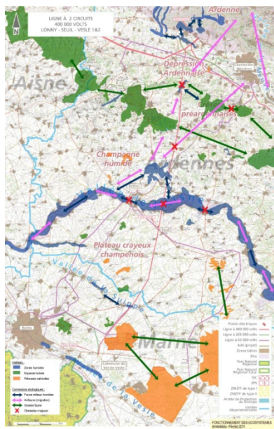
Carte 1. Fonctionnement écosystémique à l'échelle du périmètre de la ligne THT