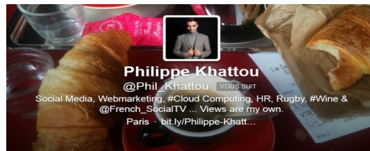
Figure 4.6 Exemples de biographies de comptes Twitter

Les pratiques de prescription entre pairs s'insèrent enfin et surtout dans la syntaxe mobilisée dans les échanges ordinaires. Elle s'appuie sur un ensemble de signes conventionnels ayant émergé des échanges entre usagers. La citation avec le signe @ peut être utilisée comme une marque de reconnaissance envers un énonciateur. Le choix de faire une reprise (RT) peut correspondre également à une tactique de mise en visibilité des comptes suivis. De même, des prescriptions peuvent avoir lieu via les messages directs (DM), en étant non visibles des autres usagers.