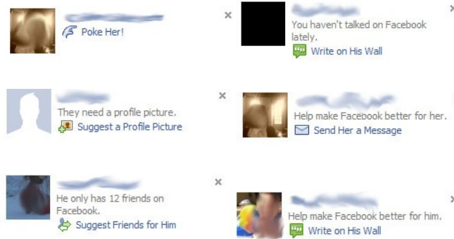
Figure 4.1. Exemples d'incitations individuelles à l'activité diffusées par Facebook

Le deuxième niveau concerne la logique individuelle de prescription proposée par Facebook. La plateforme dispose effectivement d'une forte variété d'invitations à prendre contact dont nous reproduisons ici quelques exemples :