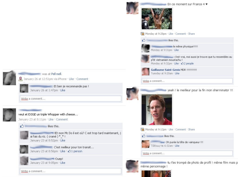
Figure 4.4. Exemples d'échanges impliquant la dimension culturelle de la consommation

Il s'agit cette fois d'une confusion de contexte dans lequel se déroulent les activités. Les enquêtés affirment effectivement prêter peu d'attention aux démarches commerciales sur le site, publicité et activité des pages incluses 20 . Surtout, ils soulignent qu'ils n'envisagent pas la plateforme comme un espace de consommation. Lorsqu'ils se renseignent à des fins consuméristes, ils déclarent passer par d'autres sites plus fiables et adaptés à leurs besoins spécifiques. S'il est souvent question de marques ou de consommation, ces échanges ne concernent que rarement l'activité de consommation. Ils peuvent servir la mise en valeur de soi si cette consommation est prestigieuse (soirée dans un grand restaurant, vacances, pratique culturelle), l'humour (jeu de mot, détournement de slogan ou d'affiche) ou relever de l'affichage d'une culture commune à une génération ou une communauté d'appartenance dont le produit ou la marque sont employés dans leur vocation culturelle de symbole. Ces évocations ne se traduisent pas par un lien évident et systématique avec un goût pour le produit ni avec sa consommation [STE 09, 11]. L'exploitation de ces échanges suppose donc un logiciel susceptible de comprendre toutes les nuances de ces second degré, ironie, private joke qui forment l'essentiel des échanges [ITO 08], et de les distinguer des cas, rares mais toutefois observés, d'échanges sérieux autour de la consommation. Nous reproduisons ci-dessous quelques exemples de ces échanges :