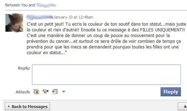
Figure 4.2. Exemples d'incitations collectives à l'activité inventées par les utilisateurs

Cette autoproduction par les usagers suggère un manque des services proposés par la plateforme. Les activités inventées par les utilisateurs reposent toutes sur une dynamique collective que ne valorise pas le site. Cette logique collective constitue le cœur de la participation des utilisateurs sur Facebook. Ils ont conscience que leurs actions sont menées face à un public 16 devant lequel ils se montrent dans l'attente de commentaires ou avec lequel ils interagissent plus profondément. Nous avons ainsi proposé de distinguer quatre formes de configurations où les actions sont menées : le cérémonial, la cour, la bande de potes et la sphère publique à structure médiatique [COU 10]. Beaucoup d'applications ont intégré cette logique en proposant des activités collectives qui se sont révélées très appréciées (living social, achetez vos amis, my friends secrets et toutes celles permettant de se comparer sur différentes activités, évaluations ou connaissances). Les formes de prescription employées par Facebook, au contraire, sont focalisées sur l'individu. Elles n'attribuent pas un rôle actif au groupe et ne l'envisagent que comme une variable du comportement individuel.