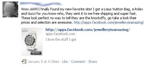
Figure 4.3. Exemple d'application employant le statut d'un usager pour diffuser un message

Il s'agit cette fois d'une confusion de contexte dans lequel se déroulent les activités. Les enquêtés affirment effectivement prêter peu d'attention aux démarches commerciales sur le site, publicité et activité des pages incluses 20 . Surtout, ils soulignent qu'ils n'envisagent pas la plateforme comme un espace de consommation. Lorsqu'ils se renseignent à des fins consuméristes, ils déclarent passer par d'autres sites plus fiables et adaptés à leurs besoins spécifiques. S'il est souvent question de marques ou de consommation, ces échanges ne concernent que rarement l'activité de consommation. Ils peuvent servir la mise en valeur de soi si cette consommation est prestigieuse (soirée dans un grand restaurant, vacances, pratique culturelle), l'humour (jeu de mot, détournement de slogan ou d'affiche) ou relever de l'affichage d'une culture commune à une génération ou une communauté d'appartenance dont le produit ou la marque sont employés dans leur vocation culturelle de symbole. Ces évocations ne se traduisent pas par un lien évident et systématique avec un goût pour le produit ni avec sa consommation [STE 09, 11]. L'exploitation de ces échanges suppose donc un logiciel susceptible de comprendre toutes les nuances de ces second degré, ironie, private joke qui forment l'essentiel des échanges [ITO 08], et de les distinguer des cas, rares mais toutefois observés, d'échanges sérieux autour de la consommation. Nous reproduisons ci-dessous quelques exemples de ces échanges :