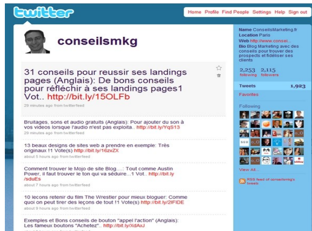
Figure 4.5. Exemple d'interface d'un compte Twitter avant la refonte de 2011

Cette logique émergente peut être appréhendée à travers les exemples du follow friday, des listes, des biographies et de la richesse de la syntaxe mobilisée dans les échanges ordinaires, que nous allons détailler.