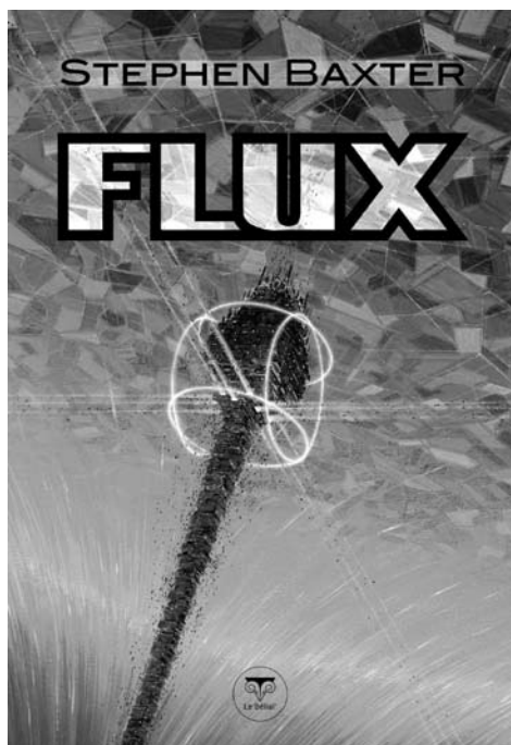
Couverture de MANCHU

Plus généralement, les règles de construction xénoencyclopédiques dépendront du statut de l'univers fictionnel considéré au regard de l'expérience humaine courante (et non de son «réalisme» au regard des lois de la physique : aussi exotique soit-il, un roman de hard science scrupuleuse comme Flux peut être considéré comme réaliste, jusqu'à preuve du contraire).