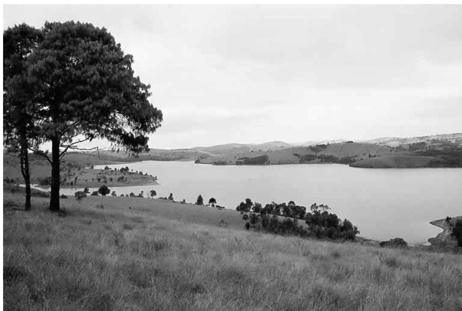
Figure 2 : Entre nuage mitataorahona , lac de Tsiazompaniry , et terres défrichées de l'est merina (cliché : auteur, sept. 2002)

Elles nous décrivent finalement, de manière simplifiée, les deux grands types de temps génériques caractérisant l'Imerina central et oriental.