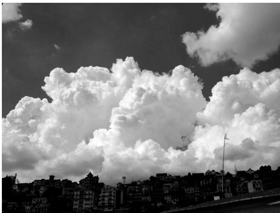
Figure 4 : Cumulonimbus en formation, Antananarivo (avril 2012)

l'inspiration du nuage qui fabrique les vents violents... » La couleur rouge, qu'ont par ailleurs évoqué d'autres témoignages, est assez fréquente sous orage lorsque les rayons d'un soleil baissant sur l'horizon sont diffractés par la très forte humidité de l'air. Nous notons également l'évocation de ce qui peut faire penser au tourbillon d'une tornade quand notre interlocuteur parle de... queue du ciel. Hypothèse que nous soumettons à notre guide-interprète de terrain. Ce dernier, natif des lieux, la confirme, témoignant avoir déjà vécu ce phénomène de tornade à trois ou quatre reprises. Il complète en évoquant l'existence d'un phénomène analogue par beau temps, moins puissant que sous orage mais suffisamment pour emporter poussières et matières légères verticalement ; ce tourbillon, appelé tadio , est d'ailleurs assez fréquent dans nos campagnes de la zone tempérée.