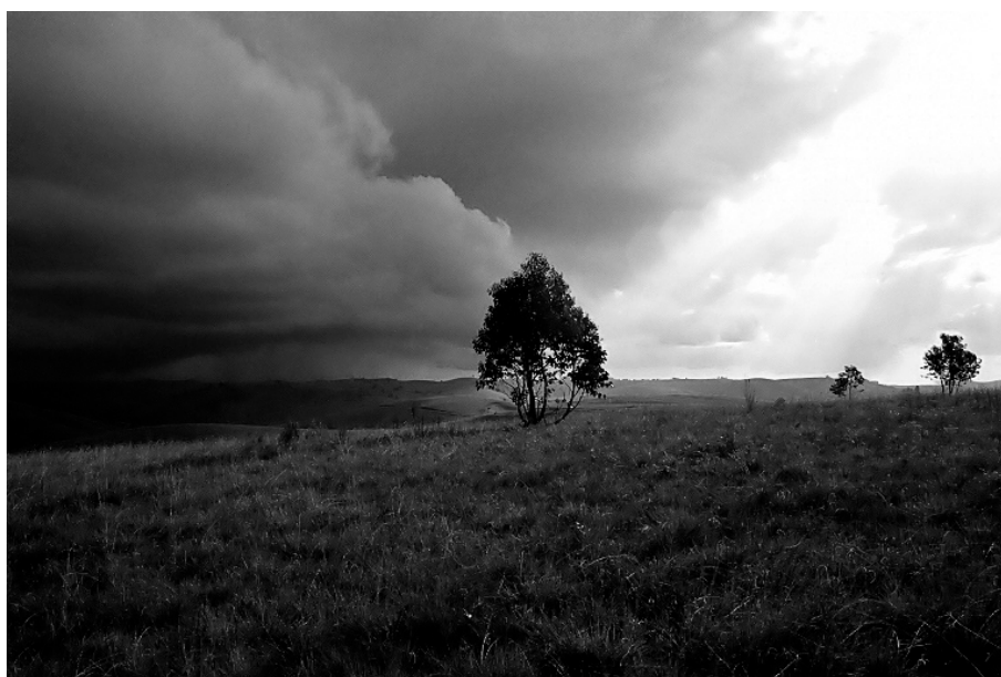
Figure 3 : L'approche d'un orage de grêle en Imerina centre-oriental (sept.2002)