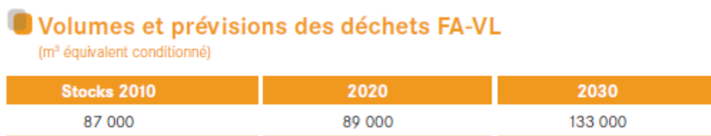
Figure 2 : Volume prévisionnel de déchets FA-VL

Les prévisions faites par l'ANDRA concernant la production de ces déchets dans les années à venir laisse à penser qu'il devient urgent de trouver une solution définitive à leur gestion.