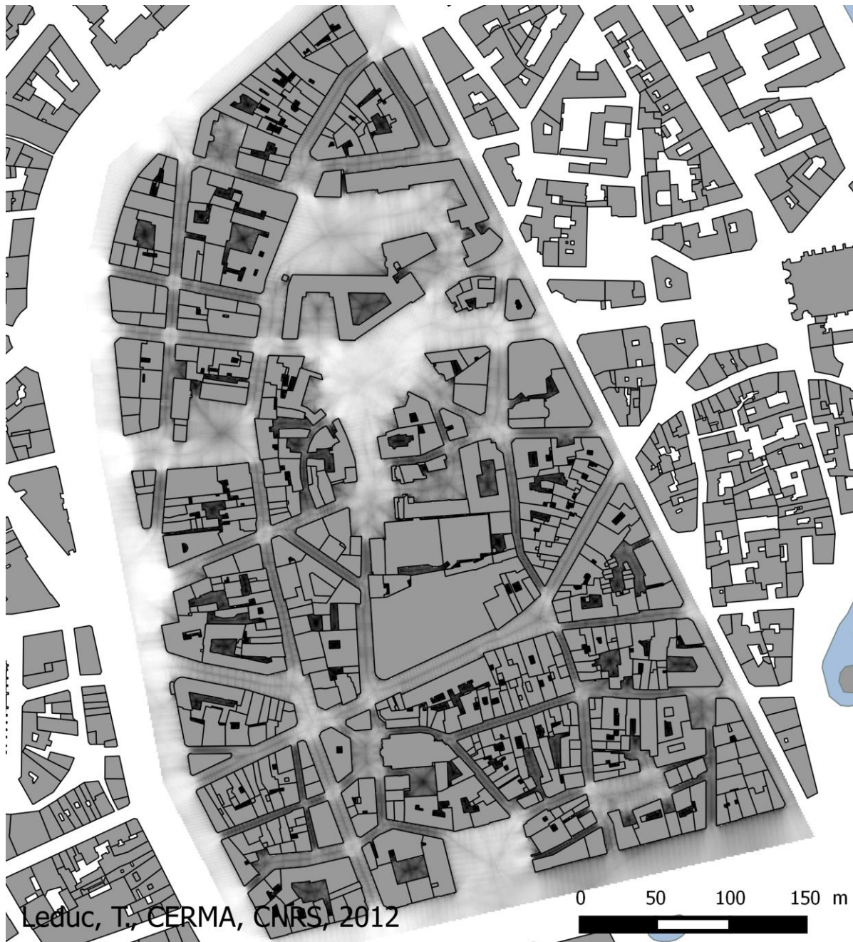
Fig. 2 : Représentation cartographique d'un champ scalaire de valeurs d'entropie de la distribution de distances radiales de l'isovist en tout point de discrétisation de l'espace ouvert du quartier du Bouffay, Nantes, France. Plus la couleur du pixel se fonce et plus l'entropie du point de vue correspondant tend vers 0.

Comme nous pouvons le constater à la lecture de cette carte, l'entropie des rues canyons de la zone tend vers 0. Celle des places et grands boulevards se rapproche a contrario de 1 (complexité minimale du déroulé de façades environnant le récepteur). Par ailleurs, le minimum de l'entropie (valeurs proches de 0) est obtenu au centre des rues canyons du fait même d'une plus grande symétrie de distribution des rayons de visibilité. Ce sont les endroits où l'on constate une symétrie frontale et latérale des parcours de rayons sonores.