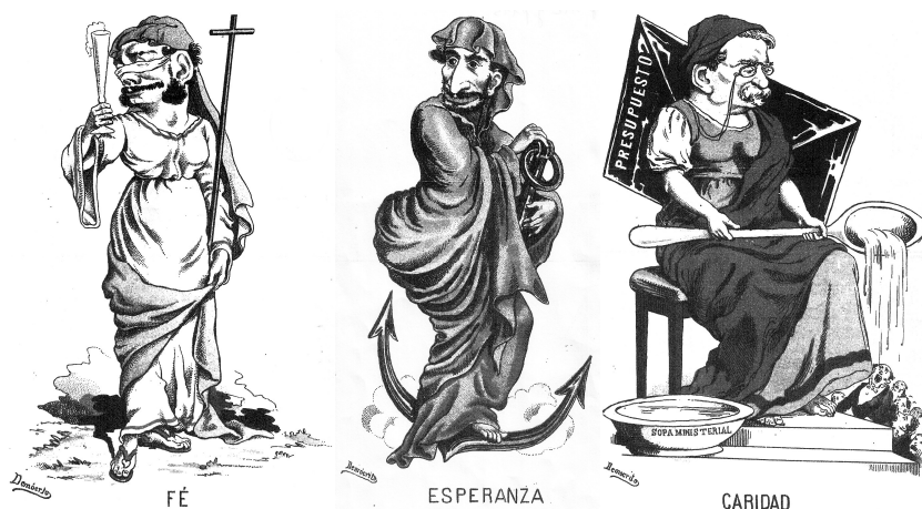
Demócrito, « Fe », « Esperanza », « Caridad », Almanaque de El Buñuelo para 1881 , p. 103, p. 121, p. 139.

El ataque de las Bellas Artes desde la técnica y la perspectiva de la caricatura no ha sido en España tan fuerte como en Francia. La alegoría como encarnación femenina de las ideas sufre en el terreno de la caricatura de la segunda mitad del XIX unos agravios definitivos. Los caricaturistas españoles no criticaron tanto la pintura del desnudo envuelto en los más diversos pretextos, pintura orientalista, mitológica, histórica etc., como los franceses. 28 La composición de Mecáchis ofrece un alcance satírico que descalifica tanto la tradición pictórica como el ruedo político. Lo monstruoso y deforme irrumpe en pinturas « que fundían la voluptuosidad del cuerpo femenino en los moldes de la forma abstracta y del convencionalismo académico, dejando al espectador la oportunidad de proyectar su deseo sobre un ser lejano e impersonal 29 ». Nos parece relevante comparar esta composición extrema de Mecáchis con la parodia de las virtudes teologales propuesta por Demócrito en el Almanaque de El Buñuelo para 1881 . 30