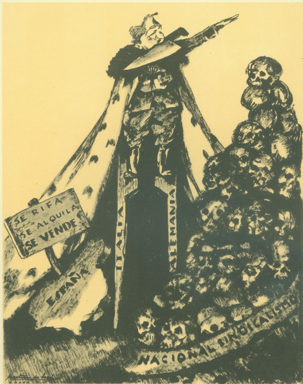
El "caudillo", la "patria" y el "Estado". Le "caudillo" chef, la "patrie" et "l'Etat". The "Chief", the "Fatherland" and the "State".