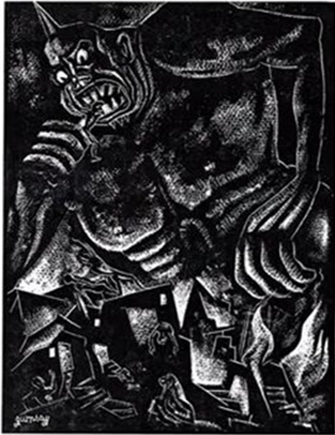
SATURNO: SIGLO XX. EL MUNDO.