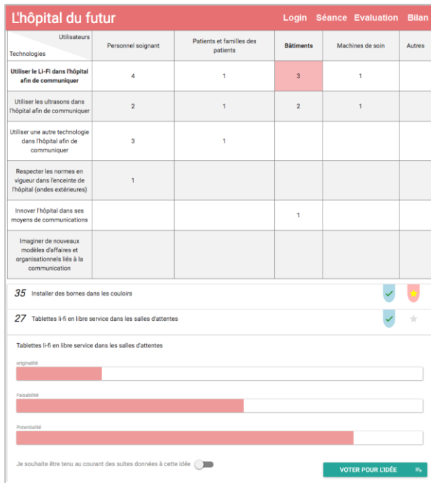
Figure 5 : Evaluation par critères et dépôt d'intérêt

L'animateur peut aussi orienter les échanges vers les idées qui mobilisent l'intérêt du plus grand nombre de participants.