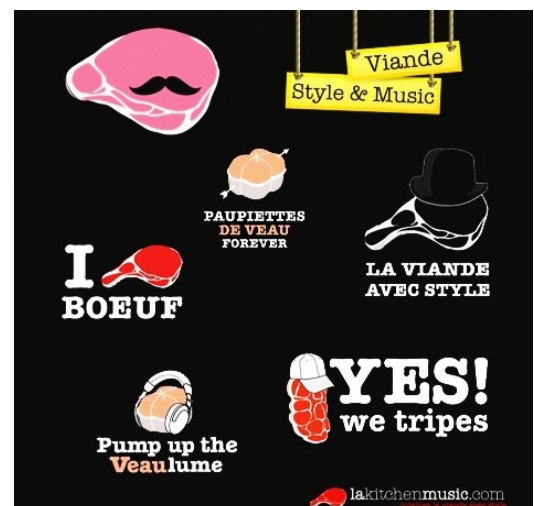
Communication sur les différents pièces de viande bovine (affiche d'Interbev, interprofession de la filière bovine)

Pour les interprofessions, la difficulté réside dans le fait de communiquer sur un large éventail de produits , auprès de cibles très variées .