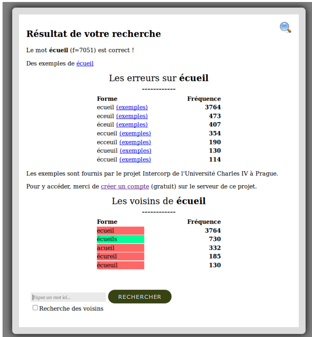
Figure 3 : exemple de page de réponse à une requête

La partie inférieure de cette page de résultats est intéressante, car elle montre que les voisins orthographiques détectés peuvent être des formes correctes (comme « écueils », signalé par un fond vert), ou des formes erronées d'autres mots (comme « écureil »). Par ailleurs, on se rend compte dans cet exemple que les formes erronées courantes ne sont pas détectées par voisinage. Cela confirme ce que nous avons déjà dit à propos du voisinage, et renforce l'intérêt d'employer de préférence les formes réduites.