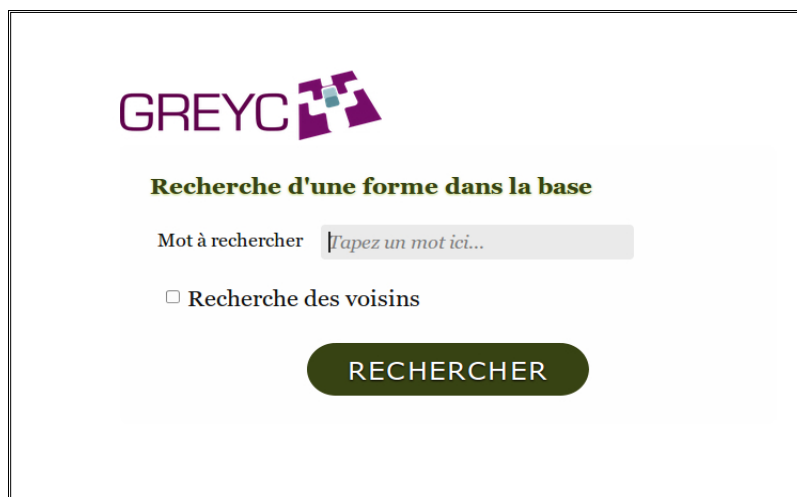
Figure 2 : page d'accueil de l'interface de la base Ortholexies

Voici la page d'accueil où l'utilisateur peut formuler sa requête :