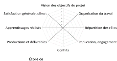
Figure 3 : évaluation individuelle sur son fonctionnement et sur le fonctionnement de groupe