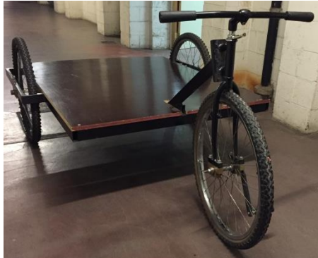
Figure 1 : L'engin à trois roues