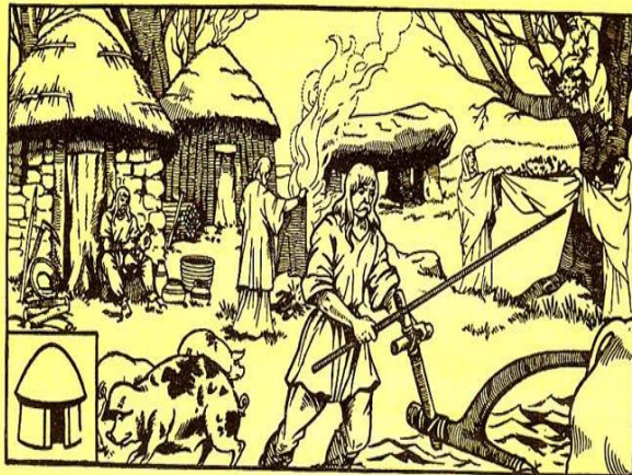
Un village gaulois.

Observons. — Décrivons la hutte gauloise. Que fait le Gaulois assis devant la hutte? — Que fait l'homme debout dans le champ? Comment est-il habillé? — Que se passe-t-il près de l'arbre, en haut et à droite de la gravure? — Regardons et décrivons les pierres assemblées ou dolmen. — Quelles sont les différentes occupations auxquelles se livrent les personnages de cette gravure?