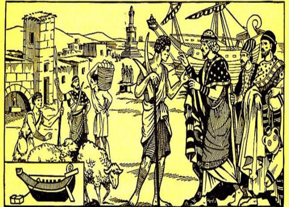
Un village phénicien.

Les Gaulois adoraient le soleil, les sources et les arbres. Leurs prêtres, appelés druides, rendaient la justice.