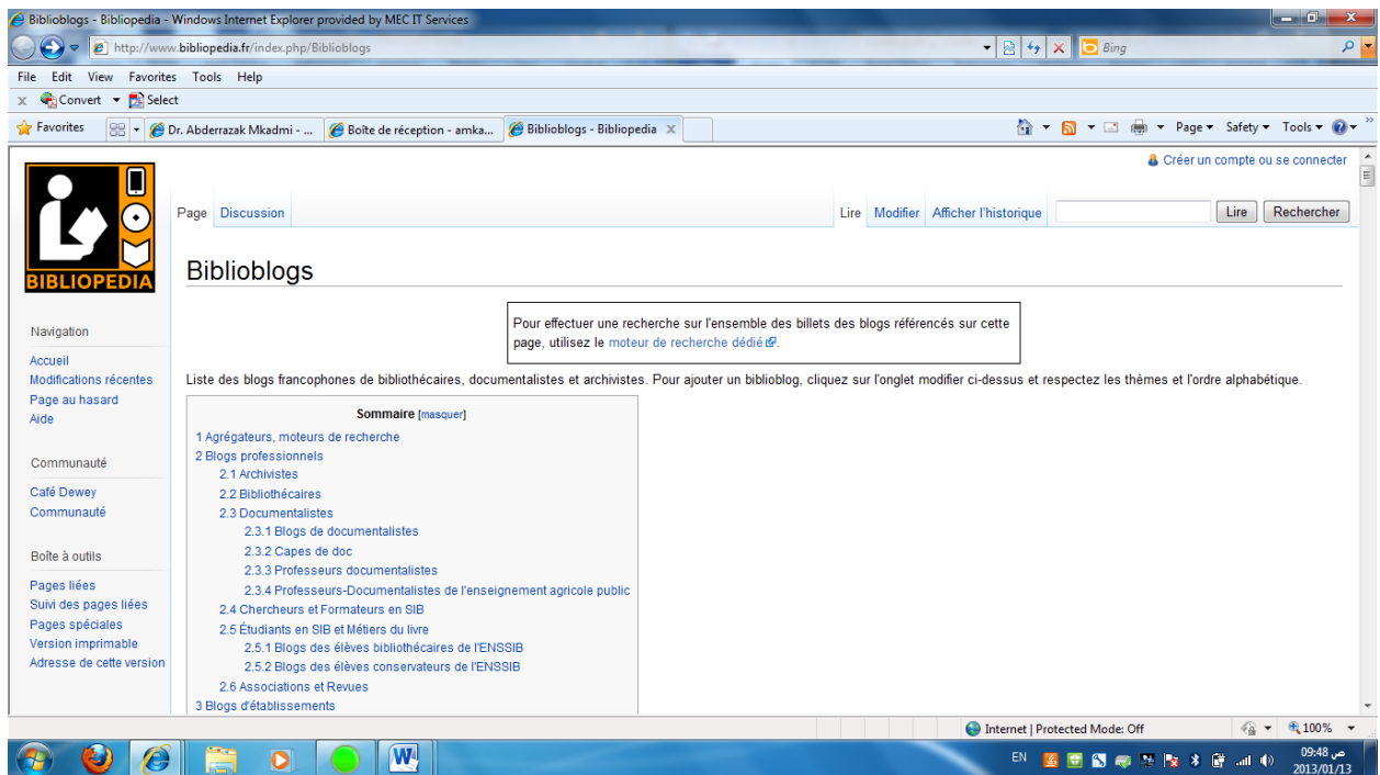
Fig. 2 : Portail des blogs des bibliothécaires, des documentalistes et archivistes francophones

Les bibliothèques se mettent aux blogs parce que ces derniers sont de nature intrinsèquement documentaire. En effet, dans les blogs, les informations postées sont automatiquement archivées. Chaque information a une URL permanente et est indexée à l'aide des balises méta qui définissent le titre, l'auteur, la date de publication, la catégorie, etc. En plus les catégories peuvent être déployées sur différents niveaux, ce qui ressemble à un thésaurus. Dans les blogs, chaque information peut être annotée à travers des commentaires. L'accès peut être géré par des droits. Nous trouvons également un moteur de recherche interne et nous pouvons paramétrer une diffusion sélective de l'information.