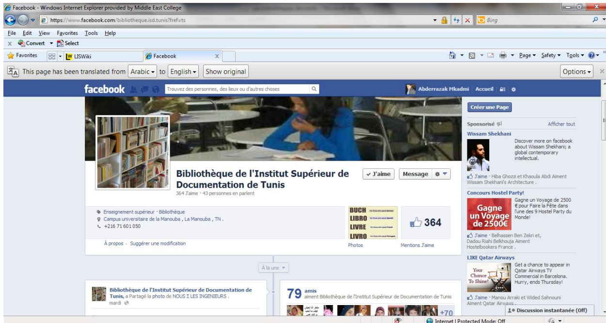
Fig. 4 : Bibliothèque de l'institut supérieur de l'ISD sur Facebook

[CHA 09] résume les avantages des réseaux sociaux dans les bibliothèques dans les points suivants :