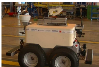
Figure 1 – La plateforme mobile Air-Cobot.

Les avions sont inspectés périodiquement lors d'opérations de maintenance que ce soit sur l'aéroport entre deux vols ou dans un hangar pour des inspections plus poussées. La diminution des périodes d'inspection est un objectif majeur pour les avionneurs et les compagnies aériennes. L'inspection est réalisée par des opérateurs humains principalement de manière visuelle, parfois avec l'aide d'outils pour évaluer les défauts.