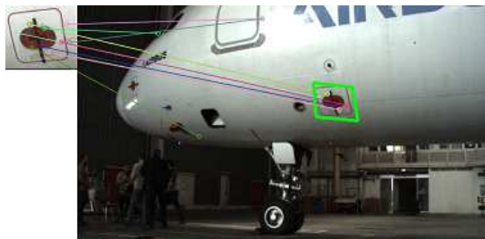
Figure 4 – Static port détecté durant la navigation du robot à partir des caméras de navigation.

Ces étapes peuvent être évitées pour le contrôle de certains éléments en effectuant l'inspection au cours de la navigation. C'est possible principalement pour ceux qui ont deux états : couvert ou non couvert comme les static ports ou les sondes. Un humain n'a pas besoin de s'arrêter pour constater leurs états, la même efficacité est souhaitée pour le cobot. De plus sur ces amers visuels qui sont également des éléments à contrôler, leur forme peut varier en fonction de leur statut ce qui peut être un problème en navigation lors de la détection et du suivi. Si c'est possible, il est donc intéressant de faire de l'inspection au cours de la navigation.