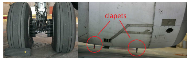
Figure 4 – Train d'atterrissage et réacteur avec loquet ouvert, photographies prises par la camera PTZ.

Une localisation basée vision est également possible. [4] Des fusions d'information entre les différentes modalités sont envisagées. Une intelligence artificielle arbitrant les différentes localisations est à l'étude. Des investigations sont menées pour utiliser les nappes lasers pour des tâches d'inspection. Par exemple, un balayage de haut en bas pourrait permettre de détecter la présence de cales devant les roues ou de loquets ouverts pour le réacteur, cf. figure 4.