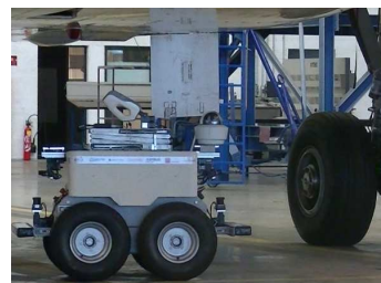
Figure 1 – Air-Cobot navigant sous l'avion.

l'odométrie des roues, la centrale inertielle et l'odométrie visuelle. Cette mise à jour se détériore au cours du temps. La seconde localisation corrige cette dérive. Basée sur des données 2D prises de manière horizontale, elle fournit une estimation de pose en temps réel du robot lorsqu'assez d'éléments parmi les trains d'atterrissage et les réacteurs sont visibles. Cette localisation est indispensable lorsque le robot évolue sous l'avion pour inspecter les trains d'atterrissage, cf. figure 1. Un indice de confiance est renvoyé en fonction du nombre d'éléments détectés et identifiés de l'avion. La localisation a été testée sur des avions A320 dans les locaux d'Airbus et Air France en extérieur et en hangar.