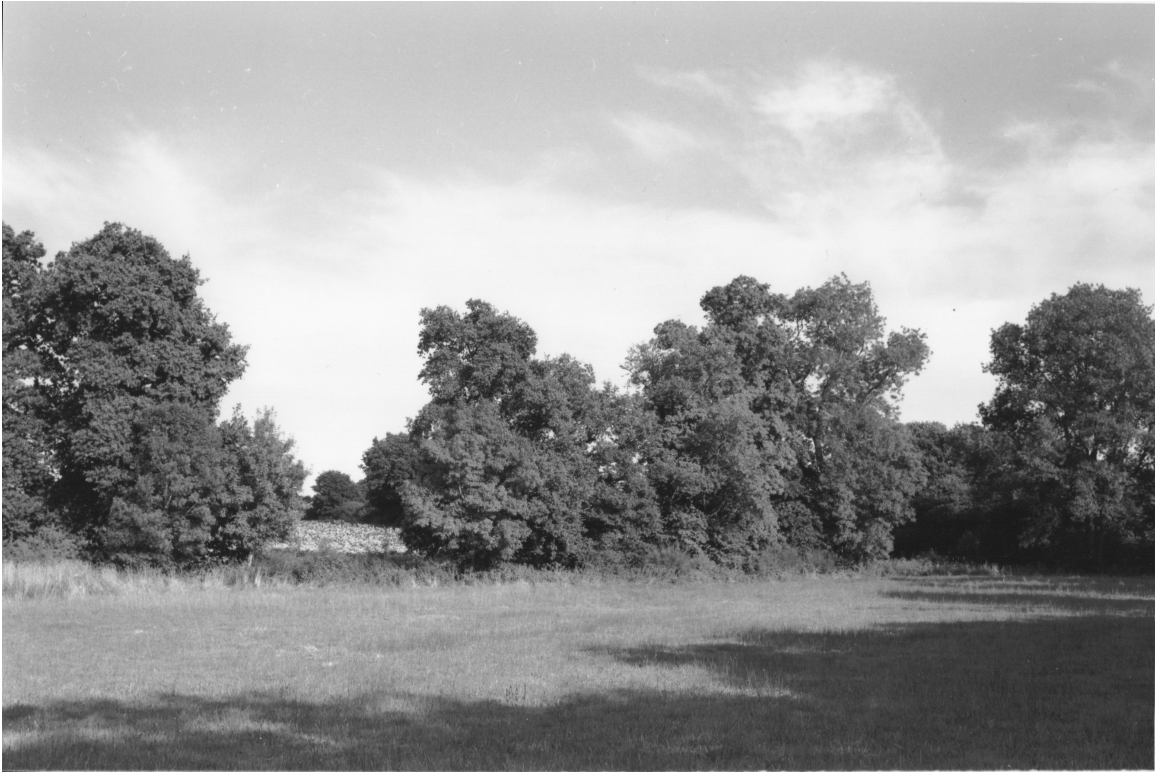
Le bocage breton dans les environs de Notre-Dame-des-Landes (Loire-Atlantique), août 2013

Ce bocage à mailles serrées a gardé sa géométrie d'origine; mais les haies (où les chênes sont dominants) n'y ont pas été taillées depuis un certain temps. Un arbre manque, et le regard trouve une échappée plus loin, au-delà de la prairie du premier plan, vers un champ déjà récolté.