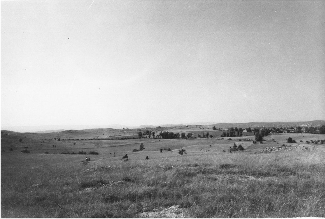
Le Causse du Larzac en 1975

Le plateau se présente comme un paysage ouvert, occupé par une steppe-pelouse. Il est utilisé en parcours extensif à moutons, piqueté d'arbres, isolés, en bosquets, ou en ligne, au bord des quelques chemins qui le sillonnent. La roche calcaire blanche affleure, en blocs parfois ruiniformes.