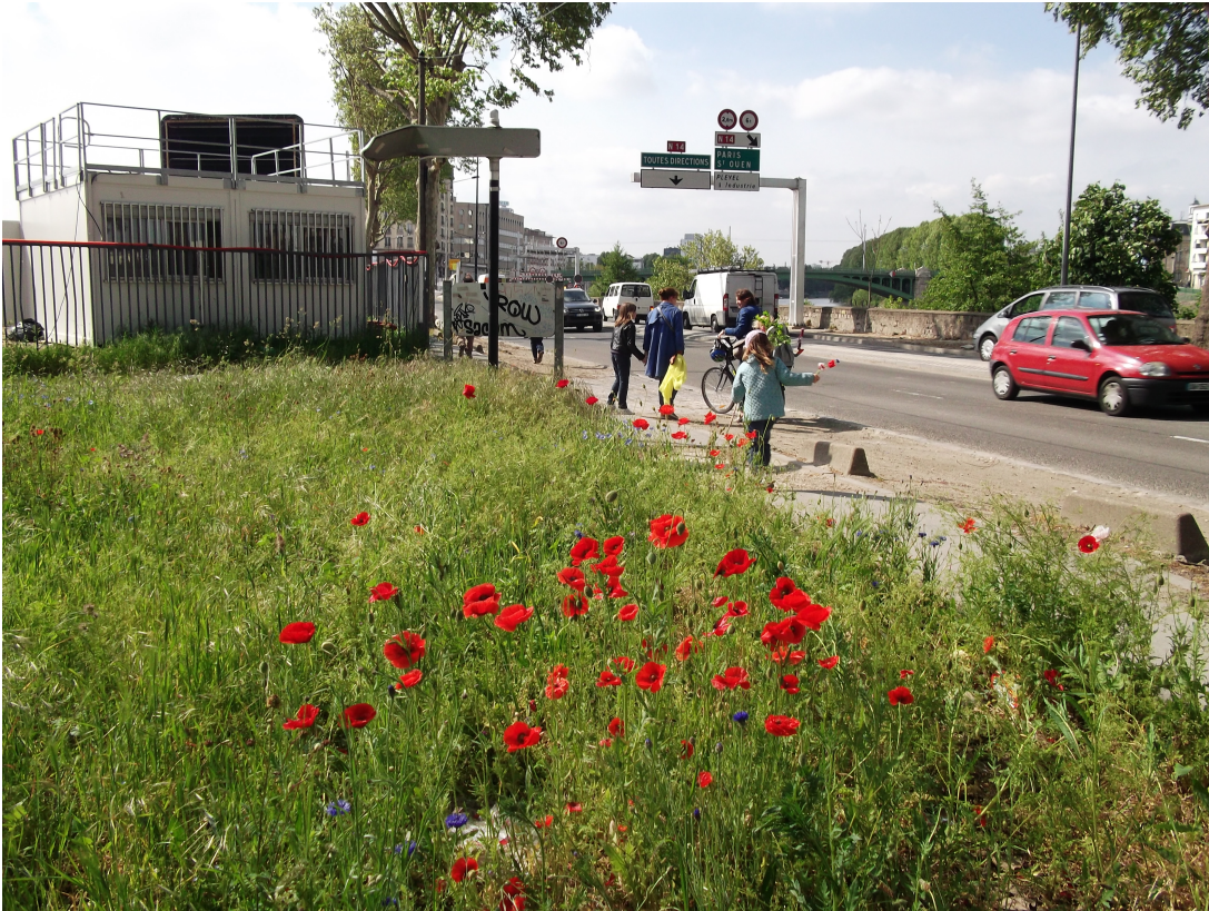
Saint-Denis, printemps 2013

En bordure d'une route très circulante qui longe la Seine, un terrain vague, où les graminées prennent l'aspect d'une verte prairie, dont émergent coquelicots et bleuets, offre sa floraison éclatante aux passants.