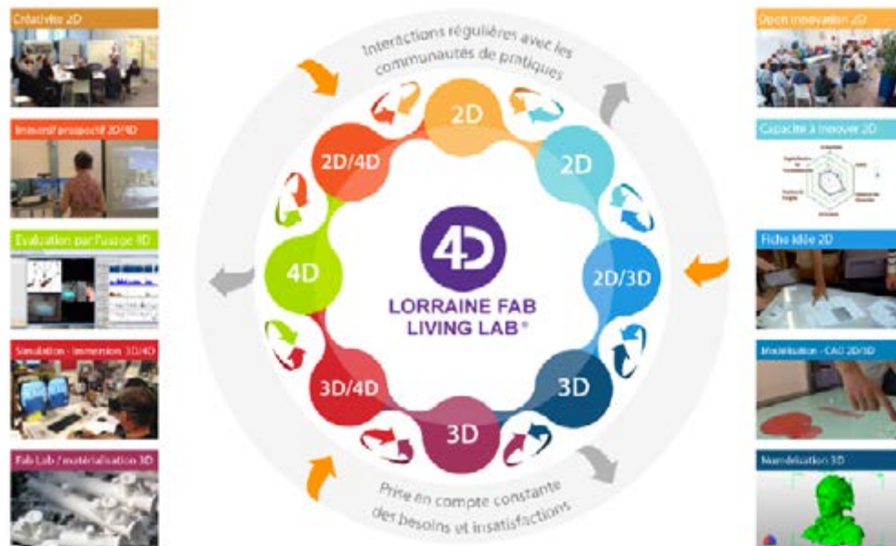
Figure 3 : Technologies mobilisables lors du processus

Par ailleurs, le laboratoire ERPI met à disposition un outil d'évaluation de la capacité à innover des PME-PMI sur la plate-forme www.innovation-on-the-web.com qui permet un diagnostic gratuit et facilement accessible pour les entreprises. L'analyse détaillée permet une optimisation de la stratégie à adopter pour développer un produit, un projet ou un processus innovant, voire d'accompagner l'entreprise sur des secteurs ou des technologies nouveaux. Ce processus facilite l'adéquation entre la genèse d'idées avec la capacité d'une organisation à les mettre en œuvre. Une méthodologie complémentaire proposant un bilan de compétences et un plan de développement permet de plus d'anticiper l'évolution de ses systèmes technologiques.