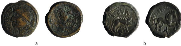
Figure 5 - Monnaies éburovices.

collections privées 7 . La légende est bien lisible et nous apprend la valeur des pièces éburovices : AS.PUBLICVS.EBRO-VICO/S AVLRC . Il n'y a pas de liaison de coin avec les autres classes ; on ne peut donc être absolument certain que celles-ci soient également des as. Toutefois, les classes II et III sont si proches qu'il est difficile de penser qu'elles aient pu circuler avec des valeurs différentes.