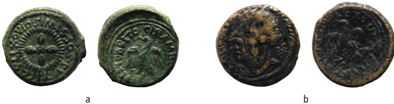
Figure 1 - Monnaies lexoviennes à légende.

La première série, frappée par les Lexoviens, offre des légendes d'une richesse rarement atteinte (figure 1) : outre le nom des magistrats responsables et le nom de la civitas , elles précisent la dénomination, un semis , qui est qualifié de « public ». Les provenances connues sont concentrées en Normandie, sur et autour du territoire des Lexoviens, donnant l'image d'une émission destinée à circuler en priorité sur le territoire civique 1 .