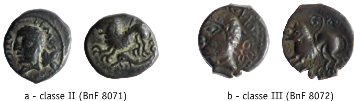
Figure 6 - Monnaies à légende ATISIOS REMOS (SST 147)

On a ainsi cherché une influence romaine dans l'iconographie des monnaies lexoviennes à l'aigle et à la fleur où P.-M. Guihard voit une référence à l'âge d'Or augustéen, ce qui suppose une frappe postérieure à 17 av. J.-C., à mon sens trop tardive 11 . Au contraire, les monnaies au portrait de CISIAMBOS ont un prototype bien gaulois, à savoir les monnaies d'ATISIOS REMOS (SST 147), dont la frappe doit probablement être placée vers 50/40 av. J.-C. : sur les classes II et III, même tête imberbe à gauche et surtout même fleur à quatre pétales derrière la tête (figure 6). Le lion du revers rappelle également celui de la classe I des grands bronzes éburovices, mais il s'agit également d'un motif un peu plus répandu. On note aussi, sur certains exemplaires de la classe II des ATISIOS REMOS et sur les bronzes à légende ATESOS et KRACCVS (SST 148 et 149), également attribués aux Rèmes, une coiffure similaire à celle du bronze éburovice de classe I. Le lien entre les monnaies normandes et les ATISIOS REMOS est d'autant plus intéressant qu'on en connaît un ex. à Neufchâtel-en-Brie (Seine-Maritime), alors que la distribution du type est concentrée en Gaule Belgique centrale et orientale 12 .