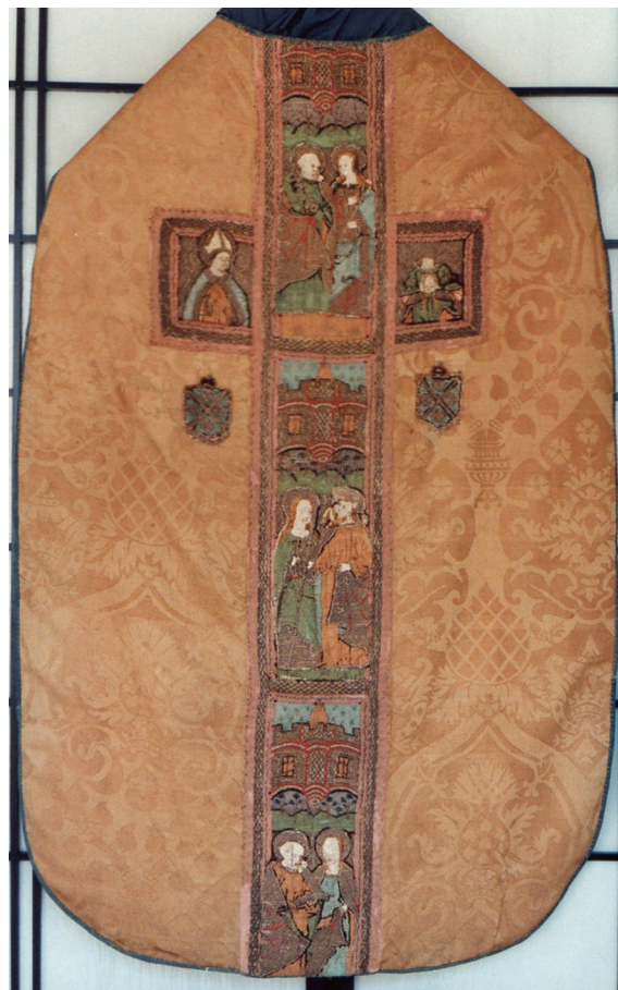
Fig. 3. Périgueux (Dordogne), cathédrale Saint-Front ; dos de chasuble.

sont parfaitement symétriques ; or, ici les feuilles sont dissymétriques et plutôt cordiformes et l'existence de petits nœuds ou cannelures sur la tige est parfaitement visible, ce qui correspond plutôt à l'aristoloche. Le nom de cette plante vient du grec Aristos , meilleur et Locheia , accouchement. Utilisée en médecine comme décontractant musculaire, elle est effectivement réputée pour faciliter les accouchements. L'aristoloche clématite est originaire de la Méditerranée. Accompagnée de la fleur de grenade, symbole de fertilité et de l'œillet, symbole d'amour, d'engagement et de fidélité conjugale, tous les éléments d'une vie privée heureuse se trouvent réunis sur une représentation dont le succès nous apparaît de plus en plus justifié. Pour autant, il est difficile de savoir si, dans les représentations qui suivent, on a suivi ce tissu pour sa valeur symbolique ou simplement pour ses évidentes qualités esthétiques. La grenade est devenue une sorte de motif générique, la fleur de grenade n'étant pas toujours représentée avec un parfait réalisme.