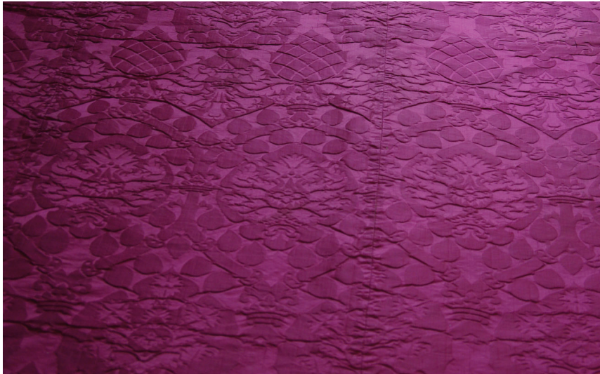
Fig. 4. Saumur (Maine-et-Loire), château ; détail du tissu d'une chape rouge.

En 2008, a été publiée une magnifique étude 4 suite à la restauration d'un vêtement d'apparat de l'électeur Maurice de Saxe (1521-1553) qui a obtenu en 1548 ce titre de prince-électeur. Le vêtement est conservé à la Rüstkammer de Dresde. A côté des aristoloches, pommes de pin, grenades et œillets, Anna Jolly fait ressortir un autre motif, qui est celui de l'anneau, emblème des Médicis, ce qui conforte l'origine possible florentine du dessin. Il faut aussi noter la grandeur d'échelle du motif pour un tissu de vêtement. Par ailleurs, cette coupe d'habit avec de magnifiques plis très profonds n'a pas pour but de montrer le motif; ce qui est important ici est de jouer sur l'or et le noir, couleurs héraldiques de la Saxe. A noter aussi le fait que l'on a recherché un des tissus les plus beaux, les plus riches de l'époque.