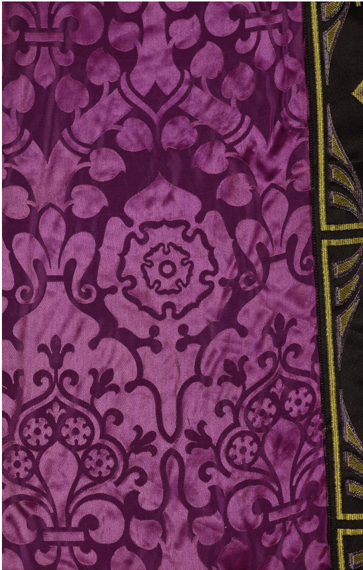
Fig. 6. Saint-Geniès-de-Comolas (Gard), église paroissiale ; détail de chasuble.

Comme pour d'autres textiles anciens, le dessin aux aristoloches a connu un succès qui perdure. Des documents du XIX e siècle reprennent ses traits 13 . Et jusqu'au milieu du XX e siècle, sur une chasuble violette (fig. 6) de Saint-Geniès-de-Comolas (Gard), vendue par la maison Clergue d'Aurillac, il est surprenant de retrouver le réseau des tiges d'aristoloches ; le reste est stylisé, les motifs de fleurs d'amandier, de fleurs de lys sont exploités pour leur aspect purement décoratif.