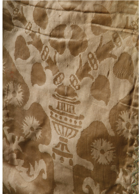
Fig. 1. Dessin du damas de la chasuble de Saint-Maurice-en-Cotentin (Manche). Dessin J. Pagnon.