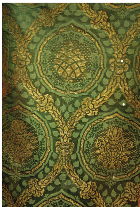
Fig. 5. Lyon (Rhône), Musée des tissus ; détail d'une dalmatique verte (MT 29424).

Il semble en effet qu'au fil des décennies, le dessin se déplace d'un intérêt pour des motifs assez petits, détaillés voire précieux, ayant une valeur chacun pour eux-mêmes - les tiges feuillues, la fleur de grenade, les œillets, le vase, la couronne (présente ou non) - vers une volonté de mettre en valeur de grandes masses aux lignes nettes, des réseaux. Par exemple, sur une dalmatique 11 italienne verte (MT 29424) qui doit être de la fin du XVI e siècle exposée au musée des tissus de Lyon (fig. 5), ressortent d'une part le treillis de lignes, d'autre part un médaillon circulaire dans l'espace ménagé par les lignes 12 .