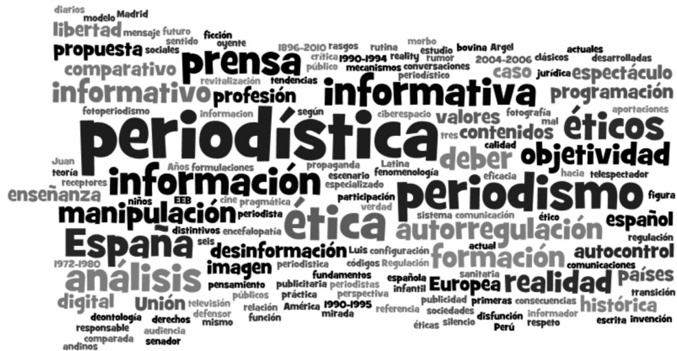
Cuadro 6: Nube de palabras con los títulos de las tesis doctorales

En el Cuadro 6 pueden verse los términos que aparecen en los títulos de las 75 doctorales analizadas, su mayor o menor tamaño en la imagen está directamente relacionado con su frecuencia de aparición. Se trata de una nube de palabras que ha sido generada con el programa Wordle ®.