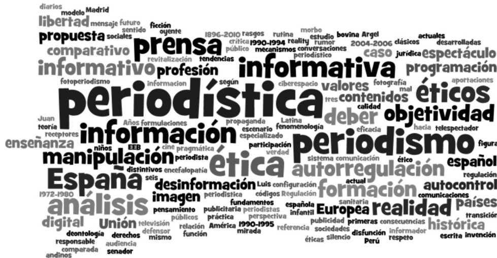
Cuadro 6: Nube de palabras con los títulos de las tesis doctorales

En el Cuadro 6 pueden verse los términos que aparecen en los títulos de las 75 doctorales analizadas, su mayor o menor tamaño en la imagen está directamente relacionado con su frecuencia de aparición. Se trata de una nube de palabras que ha sido generada con el programa Wordle ®.