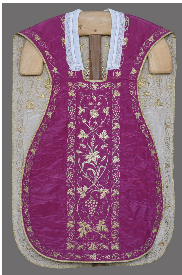
Fig. 11. Bourges (Cher), cathédrale Saint-Étienne ; ornement rouge/blanc : devant de la chasuble, face rouge.