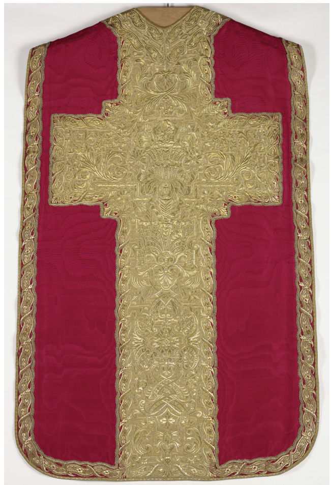
Fig. 5. Montpellier (Hérault), collection de l'évêché ; ornement rouge/blanc : dos de la chasuble, face rouge.

L'ornement rouge/blanc de Montpellier (50) (fig. 5), dont le dessin sur étoffes rouges et blanches est le plus sophistiqué de tous, sans la moindre répétition de motif sur toute la hauteur de la broderie, date du milieu du XVIII e siècle.