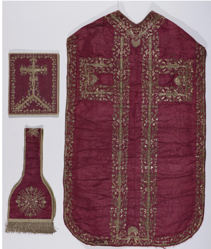
Fig. 7. Moulins (Allier), musée de la Visitation, dépôt du monastère de Poitiers ; ornement violet/vert : dos de la chasuble, face verte.