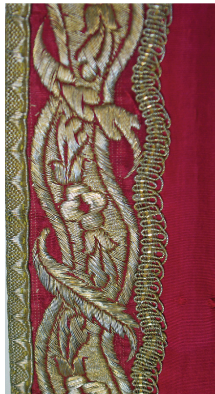
Fig. 3 et 4. Montpellier (Hérault), collection de l'évêché ; ornement rouge/blanc : ci-contre, détail du galon cachant l'insertion d'étoffe de restauration ; ci-dessous, détail du manipule restauré.

Les principes de l'exécution de la broderie à double endroit rendent très difficiles les restaurations ; il est impossible de désolidariser une face de l'autre et les broderies sont solides, beaucoup moins fragiles que les étoffes de fond. Pour pallier les usures, il a donc fallu venir découper le tissu abîmé au plus près des motifs brodés, enlever ce tissu et le remplacer par un autre (fig. 3). Il est difficile de cacher au mieux les points de raccords entre broderies et insertion d'étoffe neuve. L'opération est bien visible sur la face blanche de l'ornement de Tence (69), sur la totalité de l'ornement de Montpellier (50), sur la face violette de la chape violet/or de M gr de Langle, à Carcassonne (13) 20 . Le plus souvent, un étroit galon métallique cache la jonction des étoffes (fig. 4) mais fait perdre beaucoup de son élégance initiale à l'œuvre.