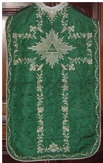
Fig. 12. Mende (Lozère), cathédrale Notre-Dame et Saint-Privat ; ornement vert/or : dos de la chasuble, face verte.

Les recherches aux archives départementales de Lozère ont permis de dater de 1872 une troisième pièce, une chasuble vert/or de la cathédrale de Mende (72) (fig. 12). Sur un fond de faille moirée en miroir, les broderies sont exécutées au fil de coton ou de soie blanc, et les motifs sont de plus en plus simples.