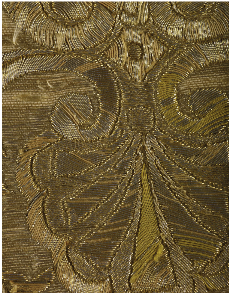
Fig. 1. Montpellier (Hérault), collection de l'évêché ; ornement rouge/blanc, macro-photographie de sorbec.

Subtilité supplémentaire, à noter sur quelques exemples 7 l'utilisation de sorbec : sous les lames d'un filé or - toujours de l'argent doré - l'âme de soie peut être de diverses couleurs, notamment verte ou rose (fig. 1). Sur la chasuble de Montpellier, les orfrois des deux faces sont faits d'une étoffe lamée or et brodée à profusion ; le sorbec ajoute des nuances colorées sur le tissu. Il n'y a pas d'exemple comparable à cette chasuble dont on ne connaît malheu- reusement pas l'origine.