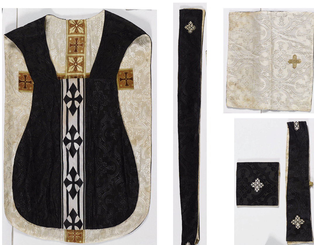
Fig. 2. Le Vigan (Gard), église Saint-Pierre ; ornement noir/blanc.

Une chasuble mesure environ 110 cm de hauteur sur 65 cm de largeur. Cependant cinq 18 ornements noir/blanc et un violet/noir 19 conservés à l'église paroissiale du Vigan (41) (fig. 2), au Musée de l'Armée (107), à la Maison diocésaine de Mende (73), à l'église de Portes (44) et à l'abbaye de Hambye (83-84) montrent des pièces de proportion bien moindres ; ainsi les chasubles font de 78 cm à 88 cm de hauteur pour 50 cm de largeur, c'est-à-dire une largeur de laize. Les étoffes sont toutes d'un XX e siècle bien entamé, avec des galons tissés ; on sait que l'ornement du Vigan a appartenu au Père Scribe, ordonné en 1949. Ces réversibles très modestes, faciles à plier et transporter, appartenaient à des prêtres impliqués dans des conditions de vie difficiles, guerre ou terre de mission.