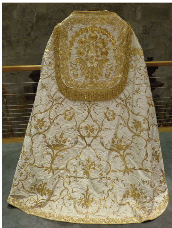
Fig. 9. Grenoble (Isère), cathédrale Notre-Dame ; ornement rouge/blanc : chape, face blanche.

L'ornement violet/vert de la Visitation de Poitiers (122) (fig. 7) dont les motifs sont très proches de ceux de l'ornement violet/or de M gr de Langle (13) (fig. 8) devrait être du milieu du XVIII e siècle. La chasuble rouge/blanc de Tence (69) est également du XVIII e siècle, de même que le grand ornement rouge/blanc de la cathédrale de Grenoble (65) (fig. 9), fort original.