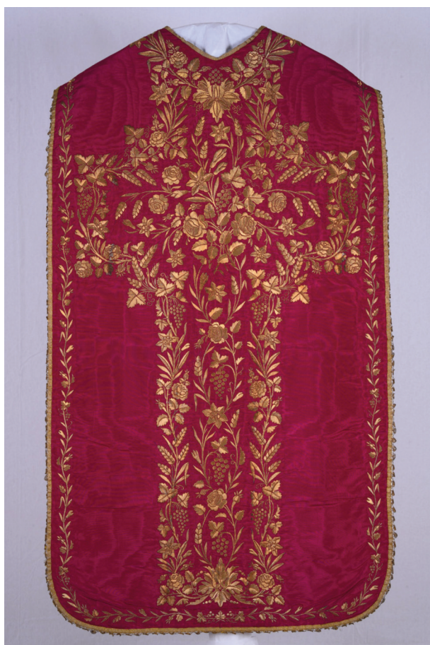
Fig. 10. Moulins (Allier), musée de la Visitation, dépôt du monastère de Paris ; ornement rouge/blanc : dos de la chasuble, face rouge.

Le second ornement daté est conservé à Bourges 39 (27), où le testament de M gr de La Tour d'Auvergne indique la fourniture d'un ornement rouge/blanc (fig. 11) brodé au filé or, par la Maison Biais, en 1870. Si l'on compare les dessins avec ceux de l'ornement de M gr Borderies, il n'y a pas d'évolution notable – mêmes fleurs de lys au naturel, même façon de dessiner les roses. Certes, la quantité de fil précieux est beaucoup plus importante dans l'œuvre de 1827 que dans celle de 1870, mais ce n'est pas parce qu'il y a recherche de diminution des coûts qu'il y a décroissance du savoir-faire des brodeurs. La ganse dorée en bordure des pièces apparaît aussi à la fin du XIX e siècle, remplaçant souvent les fines dentelles métalliques.