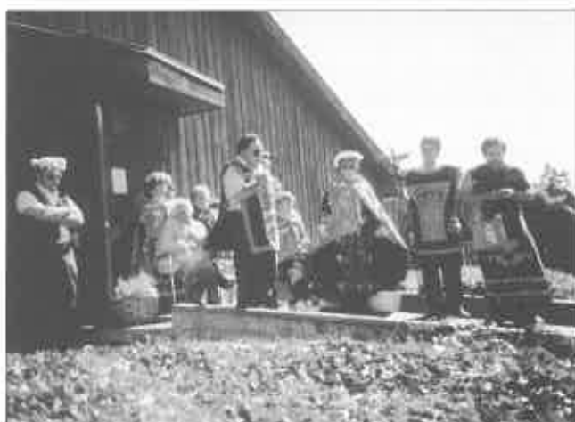
7. Cérémonie organisée à l'occasion de la restitution par le Royal Ontario Museum de la Potlatch Collection au Kwagiulth Museum (document de l'auteur, 1988).

des individus – des chefs – revendiquent pour avoir le privilège de les posséder [Mauzé, 1992 ; Townsend-Gault, 1997 : 151].