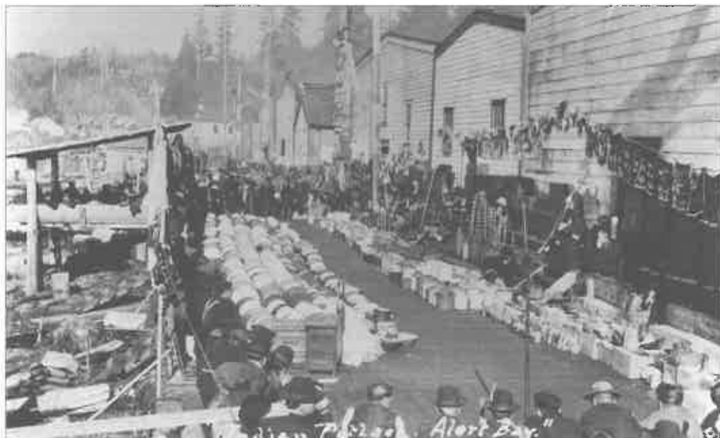
1. Potlatch à Alert Bay. Étalage des biens qui seront distribués après les cérémonies (courtesy of The Royal British Columbia Museum, Victoria, British Columbia, PN 9689, Alert Bay, cliché V.S. Lord, 1910).

Dans la littérature ethnographique, le potlatch a toujours été décrit comme une institution pivot des sociétés de la côte Nord-Ouest. Sans qu'il soit utile de revenir ici sur sa définition [Mauzé, 1986], rappelons que le mot « potlatch », issu de la langue de traite, désigne un ensemble d'échanges cérémoniels qui intervenaient publiquement à l'occasion de certains moments importants de la vie individuelle ou collective : mariage, mort, acquisition d'un nom, initiation, etc., pour lesquels les Kwakwaka'wakw et les autres groupes de la côte Nord-Ouest disposaient de plusieurs termes définissant à la fois la nature des biens distribués et le contexte dans lequel avait lieu la distribution. À la fin du XIX e siècle, « potlatch » a été utilisé par les Blancs (missionnaires, administrateurs, ethnologues) pour désigner toute cérémonie à distribution ostentatoire, avec destruction de biens ou non, ou tout système de crédit et d'investissement à des fins de prestige. Par-delà l'utilisation réificatrice d'un terme qui ne rend pas compte de la complexité d'une réalité sociale [Bracken, 1997 ; Harkin, 1997 : 125 ; Mauzé, 1996], le « potlatch » a été associé, notamment par les missionnaires, à une série de manifestations jugées répréhensibles : pratiques considérées comme cannibales, mutilations, dilapidation de biens, promiscuité sexuelle et prostitution, etc., autant de caractéristiques qui plaidaient, évidemment, pour la disparition de cette institution, au besoin par l'interdiction.