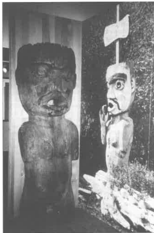
9. Statue de bienvenue à l'entrée du Kwagiulth Museum (document de l'auteur, 1980).

À Alert Bay, les objets ne sont pas véritablement présentés comme des œuvres d'art 28 , c'est-à-dire d'une manière telle que la présentation isolée des pièces mette principalement en évidence leurs qualités plastiques. Certes, le mode de présentation retenu produit un effet esthétique, mais seulement dans la mesure où le public, qu'il soit indigène ou blanc, parvient à s'imprégner de l'atmosphère que crée l'ensemble des objets, sans que lui soient fournis des éléments propres à la compréhension de ce qu'il « voit ». Il semble que le projet