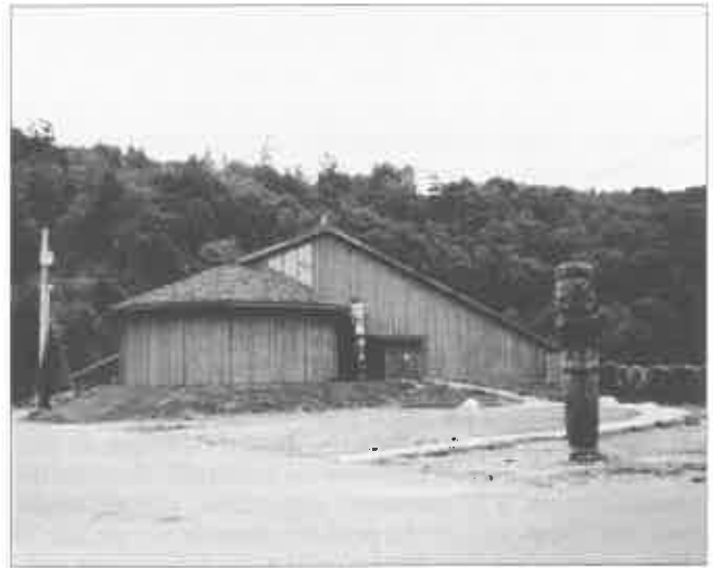
5. Le Kwagiulth Museum (document de l'auteur, 1998).

Au Kwagiulth Museum, dont le nom a été explicitement choisi pour évoquer l'ensemble des Kwakwaka'wakw, le visiteur est accueilli par deux statues de bienvenue qui, autrefois, étaient placées devant les maisons des chefs hôtes des potlatch. La galerie principale du musée est consacrée à la présentation des objets de la Potlatch Collection. Des pièces importantes – masques, sculptures représentant le serpent mythique à deux têtes ( sisiutl ) – sont exposées dans des vitrines murales. Jusqu'à la réorganisation de la galerie d'exposition en 1998, en vue de l'installation de pièces nouvelles, les