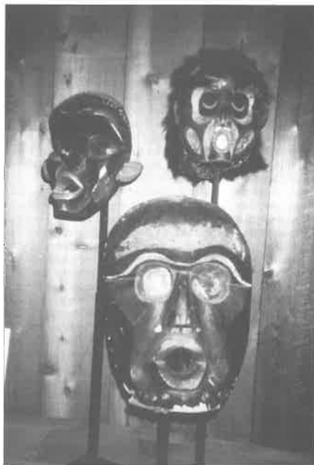
8. Masques représentant l'ogresse Dzonowqwa, au U'Mista Cultural Centre (document de l'auteur, 1987).

Le long de la rampe qui mène à l'intérieur de la maison cérémonielle où sont exposés les objets, d'anciennes photographies des villages kwakwaka'wakw sont présentées de telle sorte qu'elles rendent compte du statut de chacune des « tribus » dans la hiérarchie du potlatch telle que l'a établie Franz Boas, avec l'aide de son informateur principal, George Hunt, grand-père de la seconde épouse de Dan Cranmer. Les communautés lekwlitq qui sont restées hors de la sphère cérémonielle