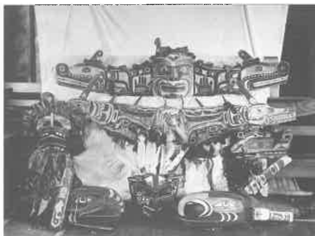
2. Objets de la Potlatch Collection exposés dans la salle paroissiale (courtesy of The Royal British Columbia Museum, Victoria, British Columbia, PN 12191, Alert Bay, cliché V.S. Lord, 1922).

Halliday décide de frapper un grand coup. À l'issue d'une enquête conduite avec le concours de trois « informateurs », plus de quatre-vingts personnes sont soupçonnées d'infraction à la loi [Cole, Chaikin, 1990 ; Halliday, 1935 : 191 ; Mauzé, 1988, 1992] ; cinquante-huit d'entre elles sont inculpées pour avoir prononcé des discours, chanté, dansé, distribué des cadeaux. La défense plaide coupable, mais essaie d'obtenir un non-lieu en indiquant que, en contrepartie de la clémence des juges, les Indiens sont prêts à cesser toute activité délictueuse. Le tribunal accepte de suivre la défense, mais à la condition que les Kwakwaka'wakw « pour prouver leur bonne foi abandonnent de leur plein gré leurs Cuivres 7 , masques, coiffures de potlatch et tout autre attirail utilisé