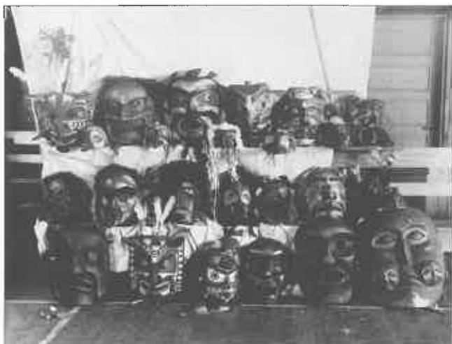
3. Objets de la Potlatch Collection exposés dans la salle paroissiale (courtesy of The Royal British Columbia Museum, Victoria, British Columbia, PN 12189, Alert Bay, cliché V.S. Lord, 1922).

les propriétaires des objets confisqués, le département des Affaires indiennes s'approprié de facto la collection ; il demeure que plusieurs des anciens propriétaires refusent la compensation proposée qui leur paraît insultante. En septembre 1922, pour un montant de 291 dollars, Halliday vend trente-cinq pièces au grand collectionneur américain George Heye, fondateur du Museum of the American Indian, qui, en 1926, devait en acquérir treize autres, lesquelles avaient été « mises de côté » par le policier B.E. Angerman 12 . La collection expertisée devait être ensuite partagée entre les deux principaux musées d'ethnographie du Canada : le Musée national d'Ottawa 13 , qui reçut environ deux cent cinquante pièces, et le Royal Ontario Museum de Toronto, qui en obtint un peu plus de cent quarante 14 . Parmi les dizaines de milliers d'objets provenant de la côte Nord-Ouest, ceux de la Potlatch Collection ont connu une destinée muséographique singulière qui doit beaucoup aux conditions dans lesquelles ils ont été réunis. Les pièces restèrent en caisse pendant plusieurs dizaines d'années. Seules quelques-unes d'entre elles furent prêtées, dans les années soixante, pour des expositions temporaires aux États-Unis, au Canada et en France 15 .