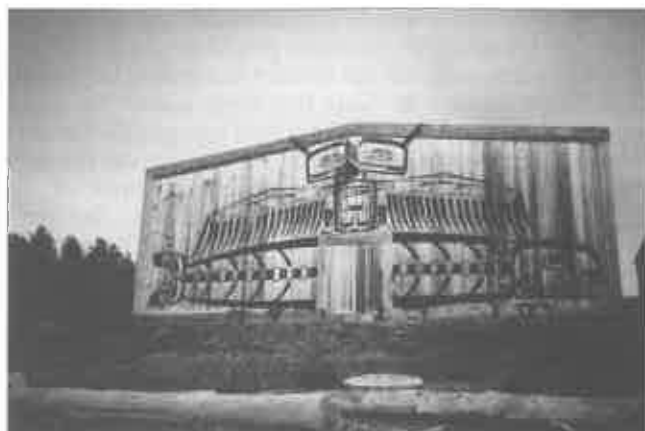
6. U'Mista Cultural Centre à Alert Bay.

Clifford a sans doute raison de souligner que le musée de Cape Mudge a « quelque chose d'intime », mais aussi « d'un peu endormi » [1991 : 229 ; 1992 : 91]. Cependant, sous cet apparent assoupissement, sont données à voir des manifestations caractéristiques de la culture kwakwaka'wakw. Celles-ci sont autant de révélateurs d'une identité locale et non définie, comme elle l'est à Alert Bay, par rapport à la totalité de l'univers kwakwaka'wakw. Ce n'est pas en tant qu'éléments du patrimoine général kwakwaka'wakw que les objets sont exposés ici, mais parce qu'ils appartiennent à quelques familles remarquables : ils ont une charge beaucoup plus importante que n'en ont les « souvenirs de famille » pour employer l'expression inadéquate utilisée par Clifford [1991 : 229]. Masques, coiffures, sifflets, Cuivres, etc., ne sont pas situés hors du temps ; ils sont historiquement datés et sont les supports de propriétés symboliques que