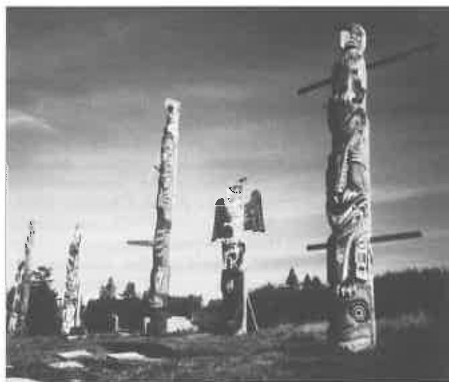
4. Le cimetière d'Alert Bay.