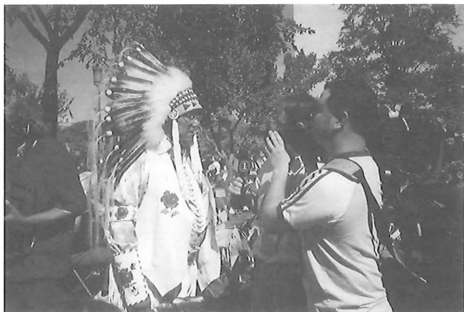
FIG. 1 – Pow wow sur le Mall