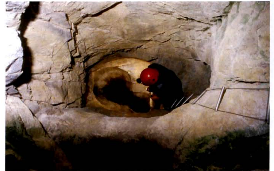
Figure 2 : Puits de mine entièrement travaillé par le feu et percé depuis la surface (secteur de la Pinée, mine du Fournel, L'Argentière-La Bessée).