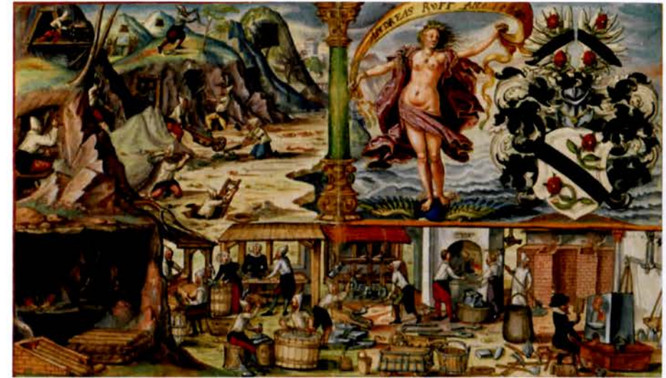
Figure 1 : Scène minière tirée de l'ouvrage d'Andreas Ryff : Münz- und Mineralienbuch , édité à Bâle en 1594 (Basel, Universitätsbibliothek, Ms. A λ. 11 46a). Dans l'angle bas gauche de l'image, un mineur est en train de s'enfuir de la mine après avoir mis le feu à un bûcher.

Le dénominateur commun des mines médiévales sud-alpines est le recours à l'abattage par le feu 8 . La technique consiste à dresser des bûchers de bois secs contre les fronts de taille et à y mettre le feu (figure n°1). La chaleur du bûcher en flammes dilate la roche et la fait éclater en surface vers 600 °C. La température peut s'élever jusqu'à 1000 °C au niveau du foyer où la chaleur attaque par conduction la sole de l'ouvrage 9 . Les travaux ouverts par le feu sont très caractéristiques. Les fosses, les galeries ou les salles plus ou moins profondes et redressées présentent des formes arrondies et des parois lisses et concaves couvertes de suie (figure n°2). Les déblais stériles, stockés sous terre à partir du moment où leur extraction vers l'extérieur devient pénible, sont également très typiques : ils présentent une stratification de niveaux plus ou moins riches en charbon de bois avec des plaquettes de roche et des sables clairs ou salis.