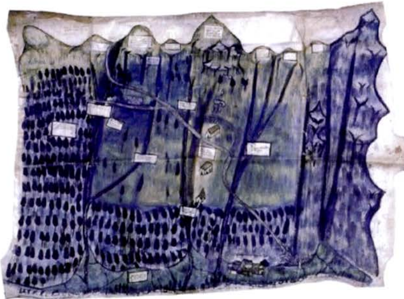
Figure 5 : Haute vallée de la Varaita (Italie), plan de l'adret.