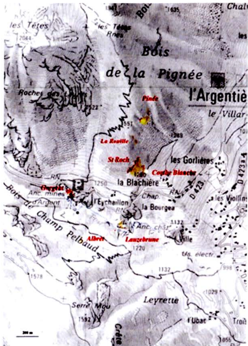
Figure 3 : Localisation des mines sur la carte IGN au 1/10000 e

prés-bois en limite inférieure et par le mélézin sur rhodoraie en limite supérieure 28 .