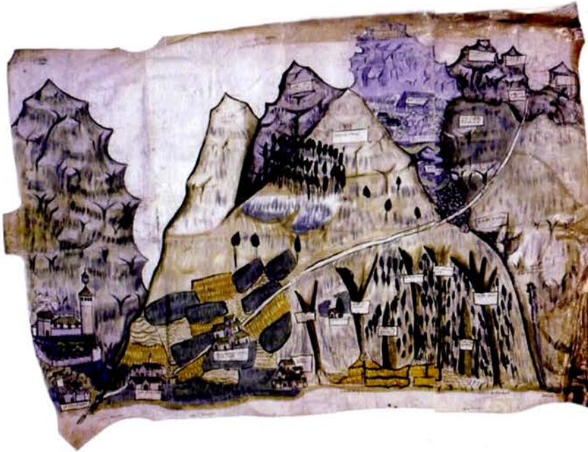
Figure 4 : Haute vallée de la Varaita (Italie), plan de l'ubac.