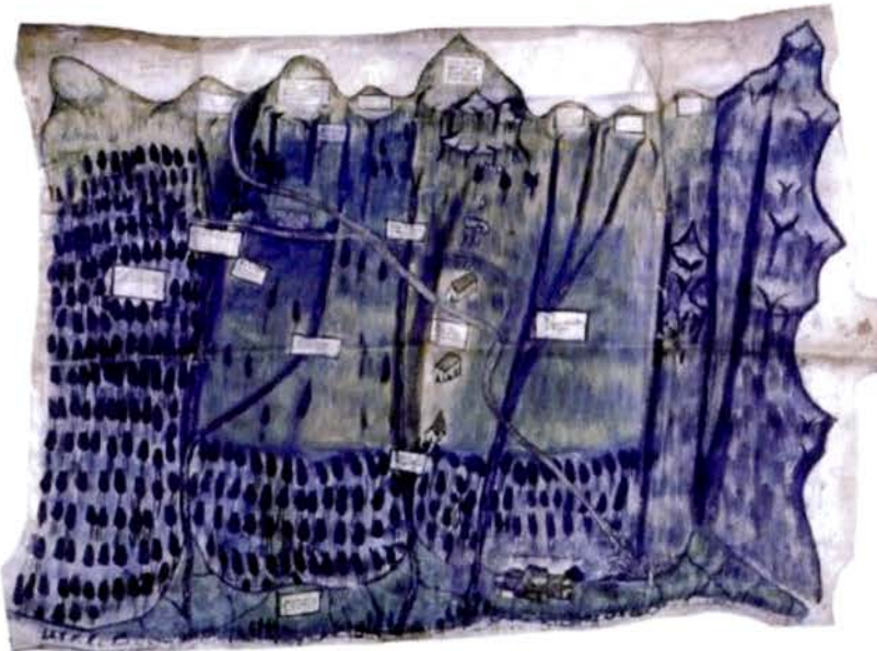
Figure 5 : Haute vallée de la Varaita (Italie), plan de l'adret.