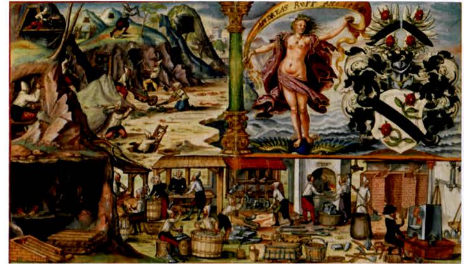
Figure 1 : Scène minière tirée de l'ouvrage d'Andreas Ryff : Münz- und Mineralienbuch , édité à Bâle en 1594 (Basel, Universitätsbibliothek, Ms. A λ. 11 46a). Dans l'angle bas gauche de l'image, un mineur est en train de s'enfuir de la mine après avoir mis le feu à un bûcher.

Le dénominateur commun des mines médiévales sud-alpines est le recours à l'abattage par le feu 8 . La technique consiste à dresser des bûchers de bois secs contre les fronts de taille et à y mettre le feu (figure n°1). La chaleur du bûcher en flammes dilate la roche et la fait éclater en surface vers 600 °C. La température peut s'élever jusqu'à 1000 °C au niveau du foyer où la chaleur attaque par conduction la sole de l'ouvrage 9 . Les travaux ouverts par le feu sont très caractéristiques. Les fosses, les galeries ou les salles plus ou moins profondes et redressées présentent des formes arrondies et des parois lisses et concaves couvertes de suie (figure n°2). Les déblais stériles, stockés sous terre à partir du moment où leur extraction vers l'extérieur devient pénible, sont également très typiques : ils présentent une stratification de niveaux plus ou moins riches en charbon de bois avec des plaquettes de roche et des sables clairs ou salis.