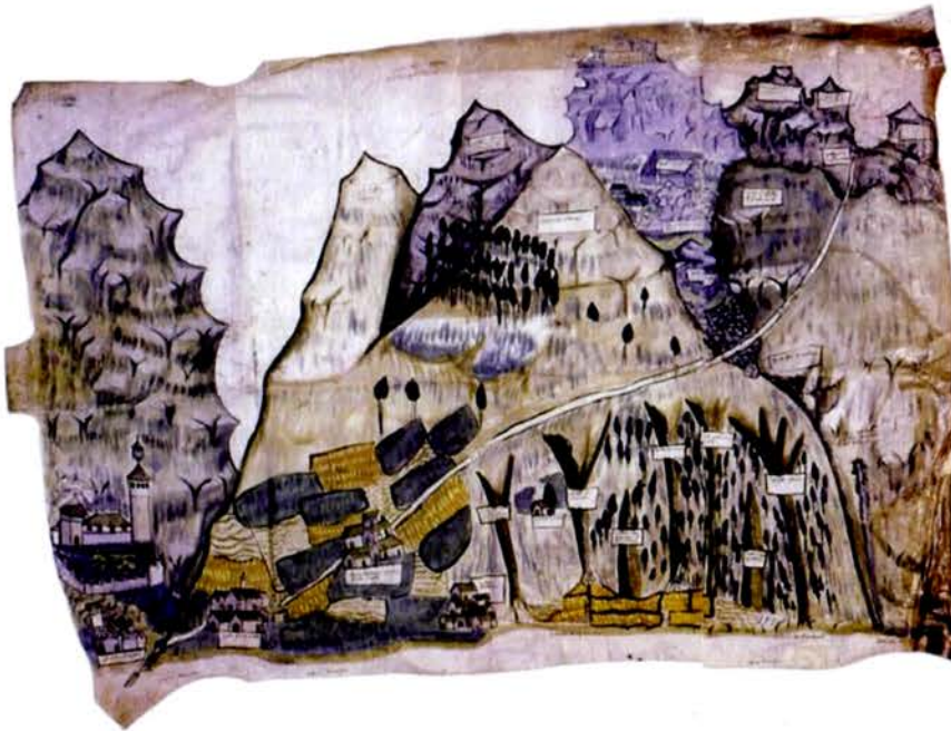
Figure 4 : Haute vallée de la Varaita (Italie), plan de l'ubac. Archives départementales de l'Isère, B 4496.