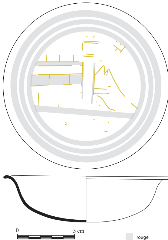
Fig. 5 Dessin de la pyxide conservée au Musée de Vienne (inv. ANSA Xla 3). (© Giuseppina Stelo, CJB, USR 3133 CNRS - EFR). Avec l'aimable autorisation du Kunsthistorisches Museum de Vienne.

Il s'agit d'un type de monument attesté dans la nécropole de Cumes. Les données stratigraphiques ainsi que la typologie et la technique de construction employée permettent de le dater des dernières décennies du II e siècle av. J.-C.