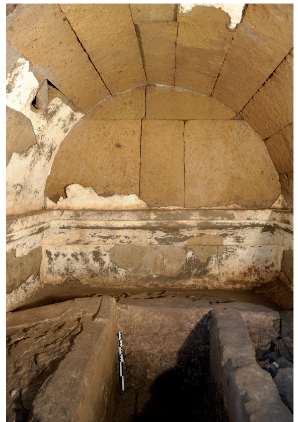
Fig. 4 Photo de l'intérieur de la chambre funéraire, vue de l'ouest.