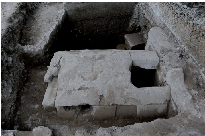
Fig. 3 Photo du mausolée vu depuis le nord

9 L'étude du petit mobilier découvert à l'intérieur de la chambre funéraire est réalisée par Marco Rossi.