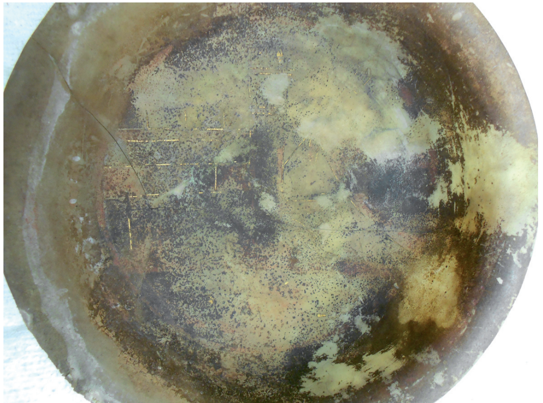
Fig. 6 Photo de détail du décor peint de l'intérieur de la pyxide.

les réserves du Musée archéologique National de Naples (Scatozza Horicht 1990, 430-432 ; Scatozza 2001, 29). Le contexte précis de découverte de ces derniers exemplaires n'est toutefois pas connu.