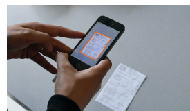
FIGURE 1 – Détection en temps réel du ticket

Dès que l'utilisateur positionne son smartphone au dessus du ticket, un algorithme cherche alors à détecter les bords et affiche par un cadre orange le résultat obtenu (Fig. 1).