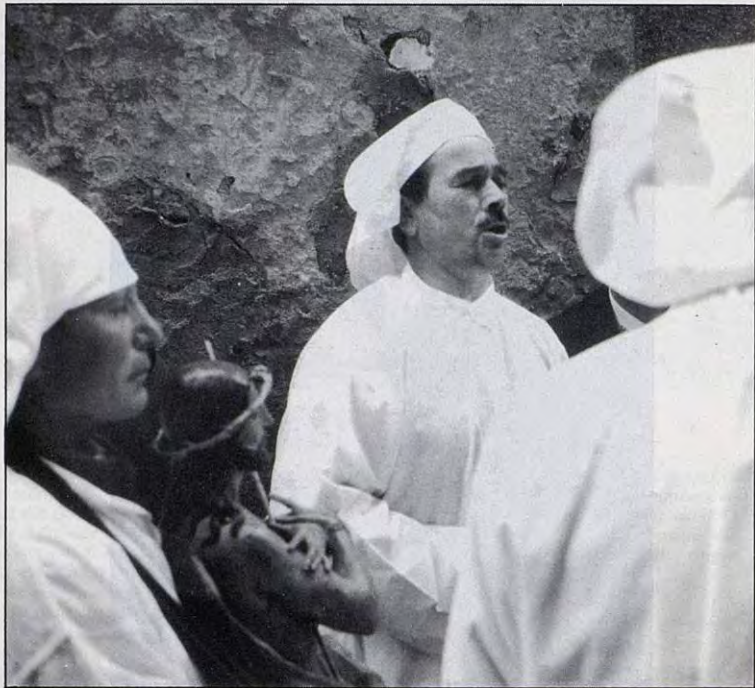
The Stabat choir and Ecce Homo , Holy Monday, Castelsardo