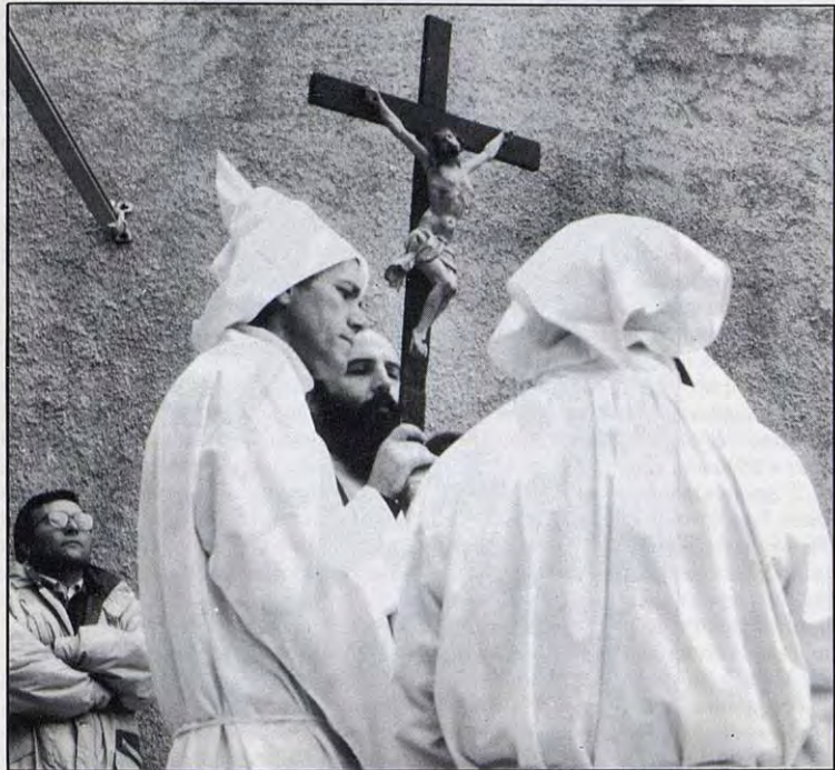
The Jesus choir and the cross, Holy Monday, Castelsardo