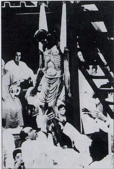
The deposition : Good Friday, Castelsardo