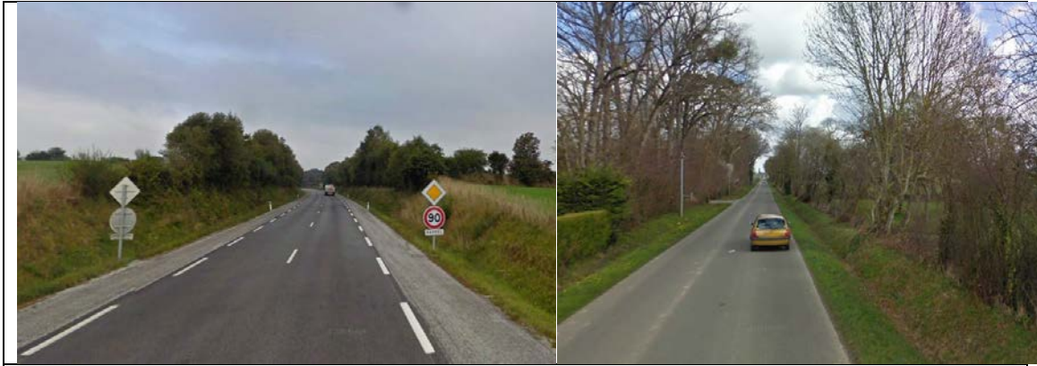
Figure 2 : voie aménagée de niveau 1 à gauche et voie de niveau 3 à droite

Si la classification commune est plus difficile à opérer pour les villes, une hiérarchisation de leur réseau prenant en considération les usages des voies, les catégories d'usagers et leurs pratiques de déplacement est à rechercher ou à revisiter, quand elle existe, notamment pour les agglomérations ne disposant pas d'un Plan de Déplacement Urbain (cf figure 3)