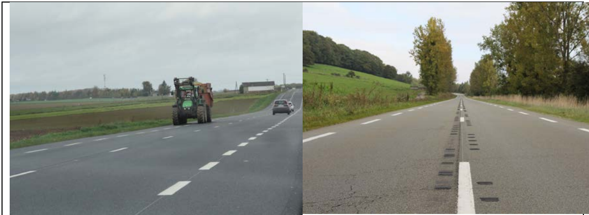
Figure 5 : exemples d'aménagements (accotements revêtus pour faciliter le dépassement de véhicules lents à gauche et bandes sonores en axe pour alerter le conducteur lors de sortie de voie à droite

De nombreuses recommandations ont été faites allant dans ce sens et promeuvent notamment :