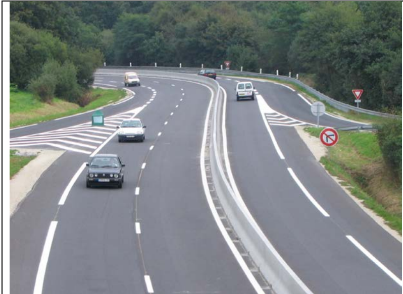
Figure 6 : aménagement en 2X1 voie pour limiter les collisions frontales en pente et en virage