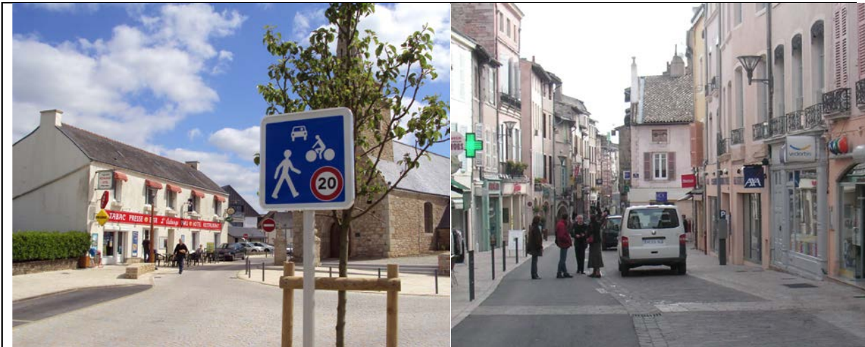
Figure 7 : Exemple de zones de rencontre, la limitation de vitesse à 20 km/h sécurise la cohabitation des piétons avec les autres véhicules.