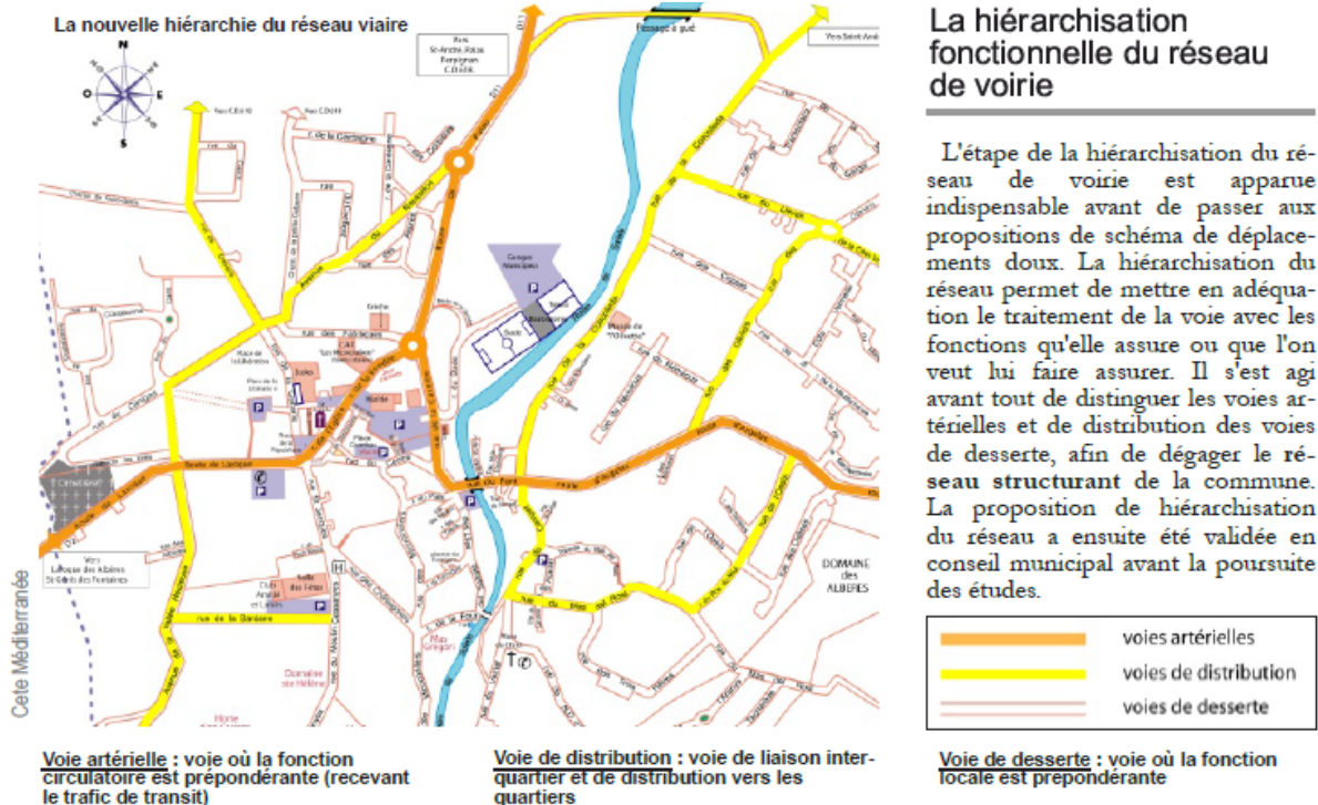
Figure 3 : Exemple de hiérarchisation fonctionnelle du réseau viaire en milieu urbain (commune de Sorède – 3 000 hab.)

Si la classification commune est plus difficile à opérer pour les villes, une hiérarchisation de leur réseau prenant en considération les usages des voies, les catégories d'usagers et leurs pratiques de déplacement est à rechercher ou à revisiter, quand elle existe, notamment pour les agglomérations ne disposant pas d'un Plan de Déplacement Urbain (cf figure 3)