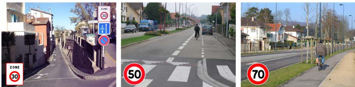
Figure 4 : La sécurité des cyclistes implique des aménagements adaptés à la limitation de vitesse et vice versa

La cohérence entre la signalisation (notamment de vitesses maximales autorisées ...) et ce à quoi ressemble la route (catégorisation par les usagers) est le meilleur moyen de favoriser des comportements individuels spontanément adaptés. (cf figure 4). De plus, les gestionnaires devront porter un soin particulier à l'entretien de la signalisation routière verticale et horizontale, là où elle est requise, afin de conserver la lisibilité et la visibilité des routes.