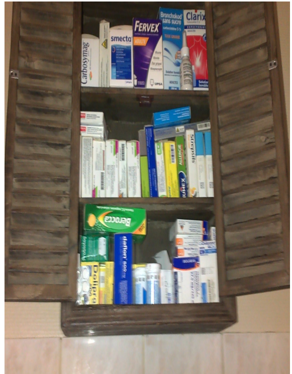
Armoires à pharmacie