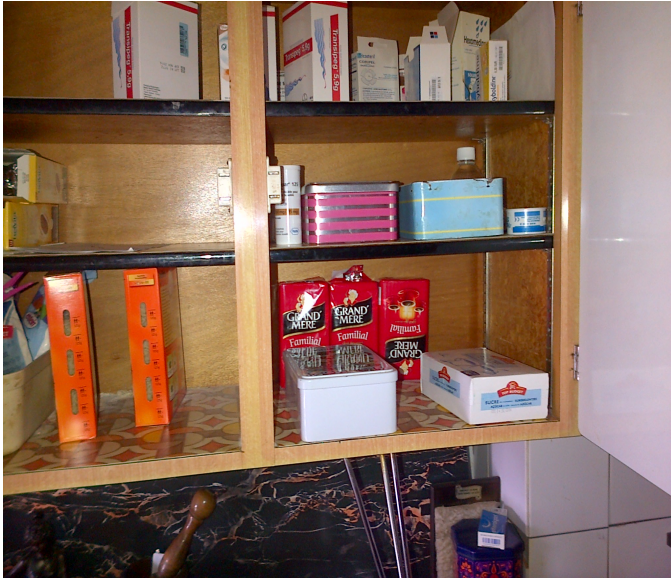
Des médicaments intégrés à la cuisine