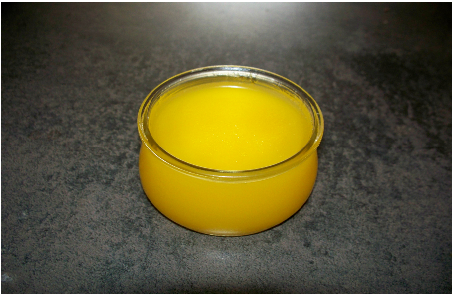
Onguent à base de Calendula et de graisse à traire réalisé par une femme, (Photographie : Déborah Kessler-Bilthauer)