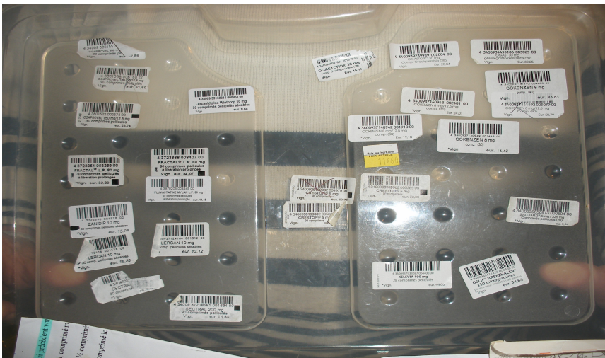
Une boîte à pharmacie organisée par étiquettes