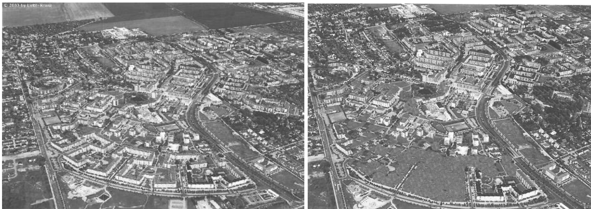
Photos 1 et 2 : La démolition de Rennebogen (quartier de Neu Olvenstedt) Source : photos de la Wobau (2003 à gauche – 2013 à droite)

Le corolaire de ce redimensionnement politique a été un redimensionnement technique. Ce redimensionnement a connu plusieurs expressions : une planification des démolitions et un redimensionnement des réseaux. Dans le cas de Magdeburg, la ville a ainsi été divisée en deux couronnes péricentrales, et la démolition de la trame bâtie devait aller de la deuxième couronne vers la première. C'est la raison pour laquelle les destructions ont surtout eu lieu dans certains quartiers périphériques, Kannenstieg, Olvenstedt et Reform : certains des bâtiments les plus récents, comme le grand serpent urbain du Rennebogen ont ainsi été démolis en premier (photos 1 à 2).