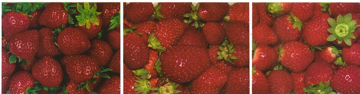
De gauche à droite : les variétés de fraises Charlotte, Cirafine et Mara des Bois

Les variétés de fraises remontantes est indépendante de la durée du jour, ainsi, dans nos conditions de climat elles peuvent fleurir et produire plusieurs fois dans l'année. Ces variétés remontantes ont donc un intérêt pour l'amateur qui peut ainsi déguster des fraises sur une longue période, d'avril à octobre.