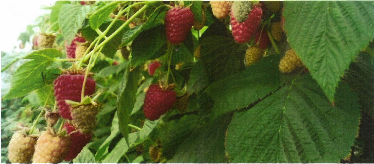
On peut multiplier aisément les variétés que l'on aura choisies pour leurs qualités

Dans les années 1980/2000, les producteurs français de framboises se sont intéressés aux variétés Meeker et Tulameen car elles présentaient des fruits attirants (couleur, forme...), étaient économiquement intéressantes (facilité de cueillette), tout en ayant de bonnes qualités aromatiques ! Ces variétés anciennes ne bénéficient plus du système de protection européen. Vous pouvez les multiplier sans problèmes.