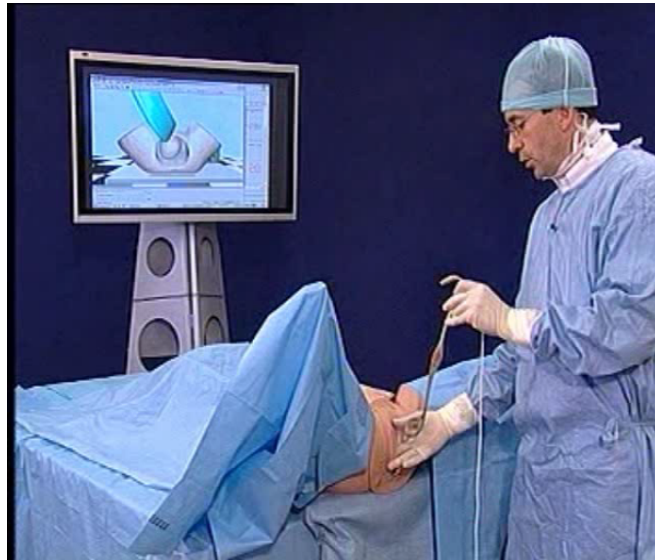
Figure 3 : Interface haptique réalisée dans le cadre d'un simulateur pour l'apprentissage de la pose des forceps au cours d'un accouchement instrumenté [MR11].

Il est nécessaire que le médecin puisse retrouver avec l'interface haptique les mêmes sensations qu'en salle d'opération (en salle d'accouchement dans notre exemple illustré par la Figure 3). Indépendamment des sensations, il doit aussi pouvoir retrouver son environnement (dans l'exemple il s'agit du bassin maternel, des forceps, de la tête du fœtus, et des repères anatomiques sur le bassin). Ceci ne peut être obtenu qu'à la condition de développer une interface dédiée pour chaque application, l'interface haptique standard ne permettant pas un rendu de qualité au médecin.