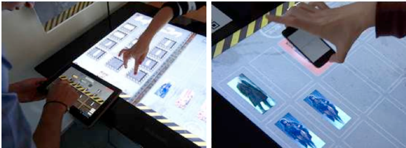
Figure 4 • Connexion entre le poste de contrôle qualité et les différents dispositifs mobiles

Ces choix de conception permettent d'évaluer différents niveaux d'immersion dans le jeu grâce aux interactions « numériques » ( i.e. interactions directes sur des objets numériques) et tangibles ( i.e. interactions sur des objets numériques via des objets physiques). Par exemple, le fait d'introduire dans la version instrumentée du jeu des gestes physiques permet de rendre compte de l'effort ou de la fatigue que peuvent ressentir les opérateurs sur certains postes de travail sur une ligne de production.