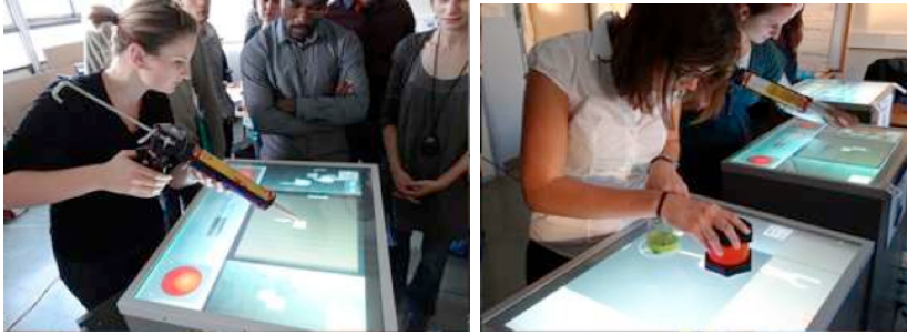
Figure 3 • Poste de travail d'assemblage et de spécification