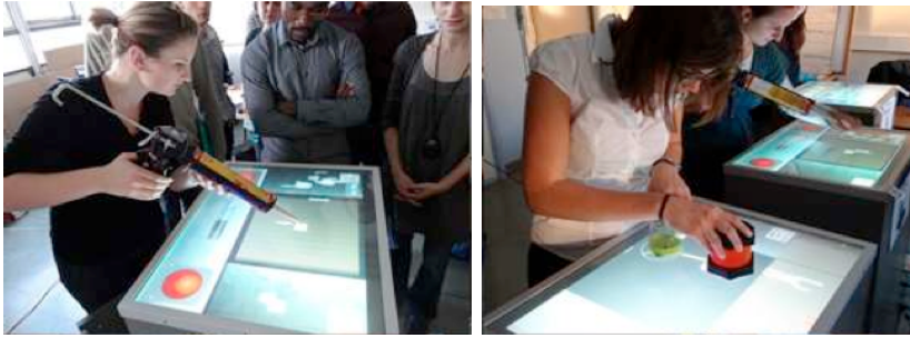
Figure 3 • Poste de travail d'assemblage et de spécification