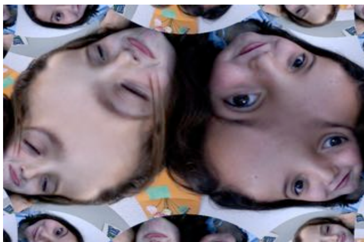
Figure 1 – Des enfants jouent avec la webcam conforme

Les arguments que ces élèves donnaient faisaient sens pour elles, étaient fondés sur l'expérience personnelle directe, leurs mouvements et leurs sensations corporelles et visuelles plutôt que sur des preuves statiques et rhétoriques.