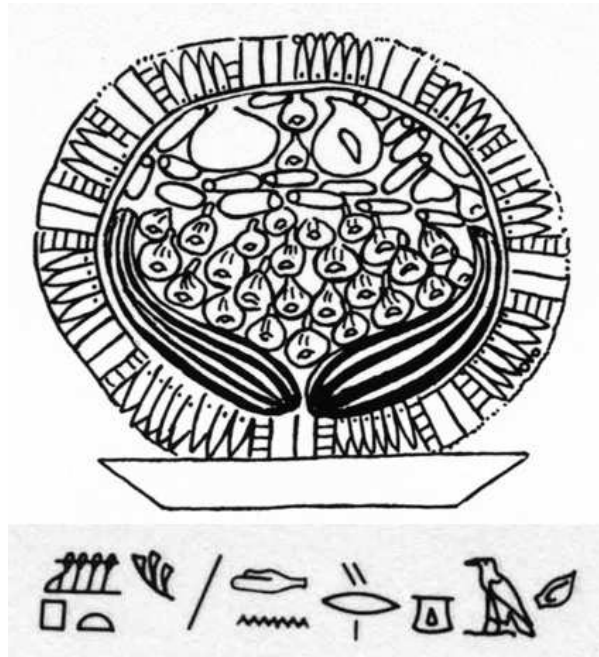
Figure 4. Deux melons (avec des figes et des dattes) dans une corbeille sur une pyramide égyptienne (vers 1200-1300 av J.C.) et nom du melon en hiéroglyphe

Cette grande diversité et les ressemblances des « melons légumes » avec le concombre ou des « melons fruits » avec la pastèque entraînent des incertitudes sur l'histoire ancienne du melon. Par exemple les Hébreux qui errent dans le désert du Sinaï après la fuite d'Egypte se lamentent en ces termes « Ah ! quel souvenir ! le poisson que nous mangions pour rien en Egypte, les concombres, les melons, les laitues, les oignons et l'ail ! maintenant, nous dépérissons, privés de tout » (Nombres 11 :5) ; on pense maintenant que les « concombres » sont en fait des melons non sucrés et les « melons » seraient plutôt des pastèques. Les textes doivent donc être interprétés avec précaution. L'iconographie est peut-être moins sujette à caution. Les plus anciennes représentations proviennent de pyramides égyptiennes (Fig. 4). Des offrandes en terre cuite datées du VI ème siècle av J.C. ont été trouvées dans un temple du sud de l'Italie. Des mosaïques romaines représentent également des melons serpents. Pline l'Ancien nous apprend que l'empereur Tibère aimait manger des concombres