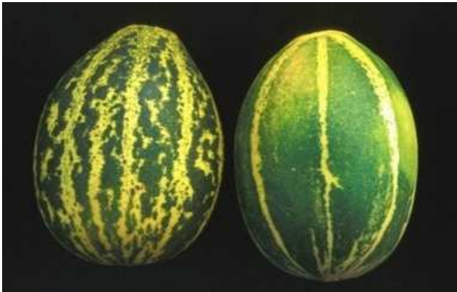
Photo 2. Melon de type tibish non sucré cultivé au Soudan; Photo 3 à droite. Melons serpents non sucrés de type flexuosus

sucrés à maturité et sont consommés généralement immatures, crus comme des concombres, cuits comme des courgettes ou après conservation en saumure ou fermentation comme des cornichons. Ces types présentent une grande diversité allant du type le plus « primitif », les tibish cultivés exclusivement au Soudan (Photo. 2), au melon serpent (groupe flexuosus ) pouvant atteindre 1,80 m de long et cultivé de la Méditerranée à l'Inde (Photo 3), en passant par le groupe conomon cultivé en Extrême-Orient, le groupe acidulus cultivé en Inde ou le groupe chate illustré sur les pyramides égyptiennes.