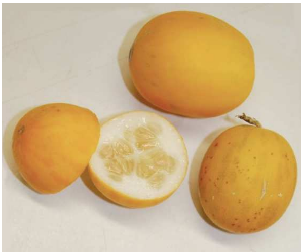
Photo 5. Melon de type chito retourné à l'état sauvage en Amérique centrale à partir de formes domestiquées introduites.

Membre de la famille des cucurbitacées, le melon ( Cucumis melo ) est proche parent du concombre ( Cucumis sativus ) et plus éloigné de la pastèque ( Citrullus lanatus ). Il est relativement facile de différencier sur les étalages en France ces trois espèces, en particulier la pastèque avec les graines réparties dans la chair et non regroupées dans une cavité centrale. Cependant, au cours de voyages à l'étranger, on peut avoir quelques difficultés à s'y reconnaître. Par ailleurs, les documents anciens ne permettent pas toujours de distinguer ces trois espèces. C'est dans un petit voyage dans le temps et dans l'espace que nous vous convions autour de la diversité biologique du melon.