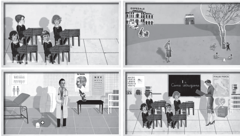
FIG. 2. Lo spot «Se».

Le quattro dimensioni d'analisi verranno dettagliate individualmente al § 3.3.