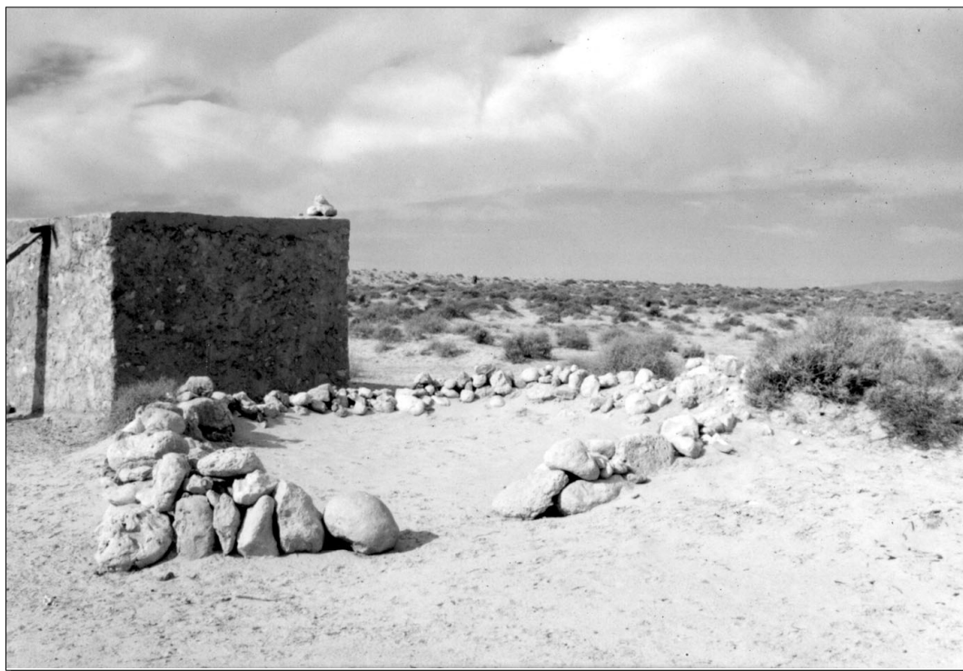
Khalwa ar-Rkârka, lieu des manifestations communautaires des Rkârka dans la steppe entre Tozeur et l'Algérie.

quelques vieux assis à l'ombre d'un arbre improbable discuter et, peut-être, déjà apprivoiser le lieu d'un prochain long séjour. Dans un coin dégarni quelques adolescents jouent au football, sans aucun respect – visible – pour les tombes – simples tas de terre surmontés d'un pieux ou deux – marquant les limites du terrain et malmenées par les impacts du ballon quand elles ne sont pas foulées par des pieds nerveux.