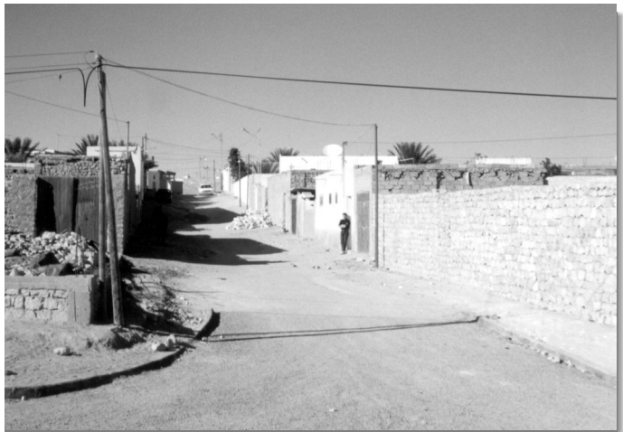
Une rue du quartier de Ras adh-Dhrâ'.