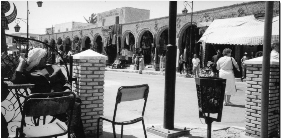
Vue du centre de Tozeur.

souvenirs des temps anciens où l'on vivait au désert. Mais l'immense majorité d'entre elles a perdu la faculté de vivre à l'extérieur au contact de l'oasis et de l'habitat rapproché, faculté qu'elles ne regrettent peut-être pas puisque sans s'éloigner de la tente, les femmes bédouines sont amenées à effectuer de difficiles tâches extérieures comme le ramassage du bois ou d'herbes médicinales. Cet enfermement des femmes dans l'espace privé et le fait qu'elles n'avaient que très peu accès à l'espace public urbain, oriente, dans le contexte d'ouverture contemporain, la sociabilité féminine publique. Si l'on excepte les quartiers bourgeois des villes, les lieux de sociabilité accueillant les femmes sont souvent dépourvus de sièges à la différence des cafés, uniquement masculins. La femme ne peut, en effet, ainsi s'inscrire durablement dans l'espace public. Elle trouve dans les « cafétérias » meublées de tables hautes circulaires un lieu public dans lequel elle peut passer un moment sans que cela ne soit inconvenant. L'absence d'endroit où s'asseoir, qui suggérerait une longue station, permet symboliquement comme matériellement – en raison de l'inconfort – de négocier cet accès féminin minimum à de nouveaux espaces. À Tozeur, ce sont les pâtisseries qui jouent majoritairement ce rôle en accueillant beaucoup de jeunes filles et peu de femmes mariées qui, hormis un éventuel emploi, demeurent dans des espaces privés ou accueillant une sociabilité uniquement féminine comme le hammam.