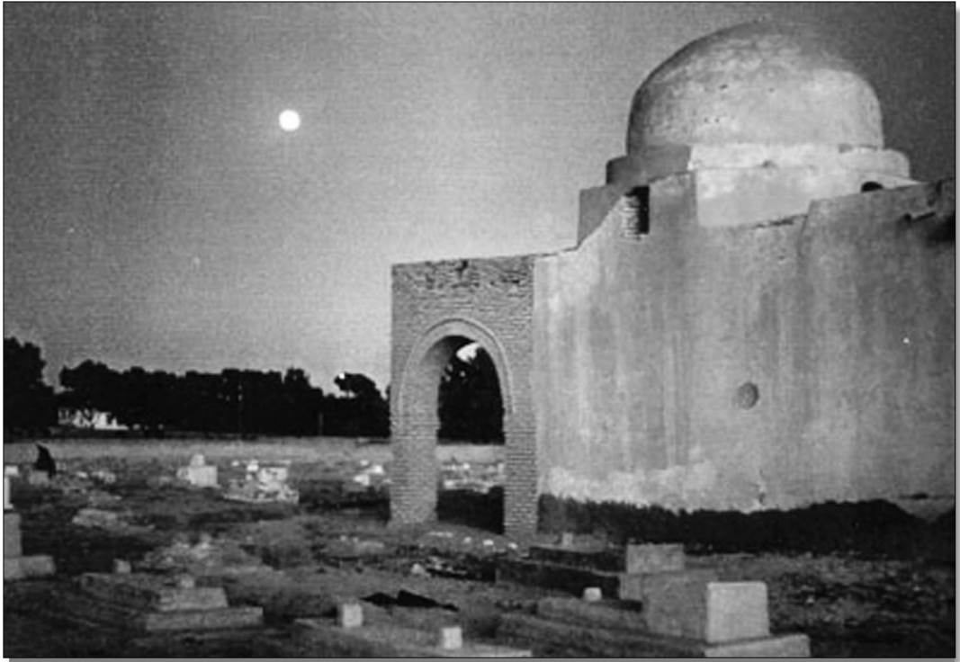
Cimetière Sîdî Abdel Rahim.

Ainsi, le terme « derrière », wara , véhicule-t-il l'idée d'un arrière-plan de la vie oasienne et citadine qui serait moins légitime, peuplé d'habitants non encore façonnés à la vie urbaine, non encore suffisamment « citadinisés », ma zâlû ma tmaddnû 17 , à la différence des groupes occupant les quartiers intra-oasiens et centraux. L'indication toponymique prend valeur de jugement dévalorisant, elle devient un opérateur majeur de la différenciation vis-à-vis des nouveaux habitants.