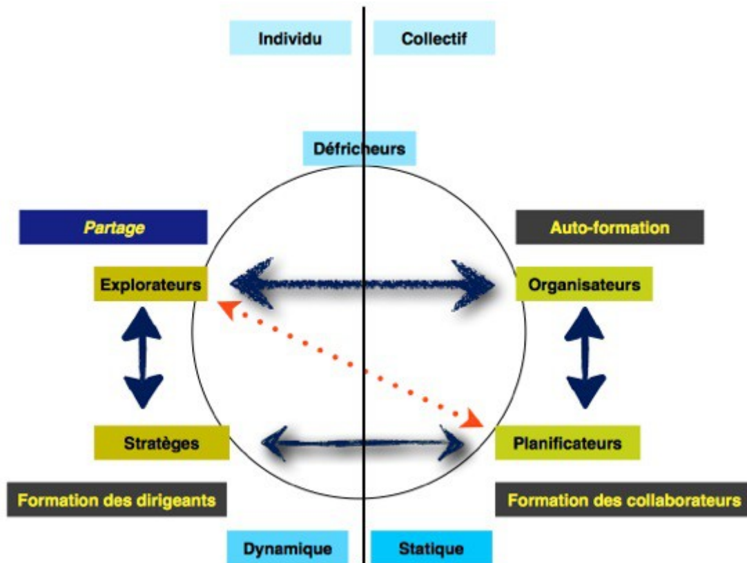
SCHEMA 2 Modélisation des trajectoires professionnelles et des formations chez les référents pionniers

Ce dernier schéma permet d'illustrer la dynamique des trajectoires professionnelles plutôt que de vouloir rechercher des parcours type. Ainsi, certains référents Explorateurs sont restés à ce profil, de même que des Organisateurs ou des Planificateurs. Symétriquement, certains Explorateurs se sont fait Organisateurs via l'autoformation, puis Planificateurs pour accroître la crédibilité de leurs pratiques. Enfin certains se sont fait Stratèges après être passés par les autres profils.