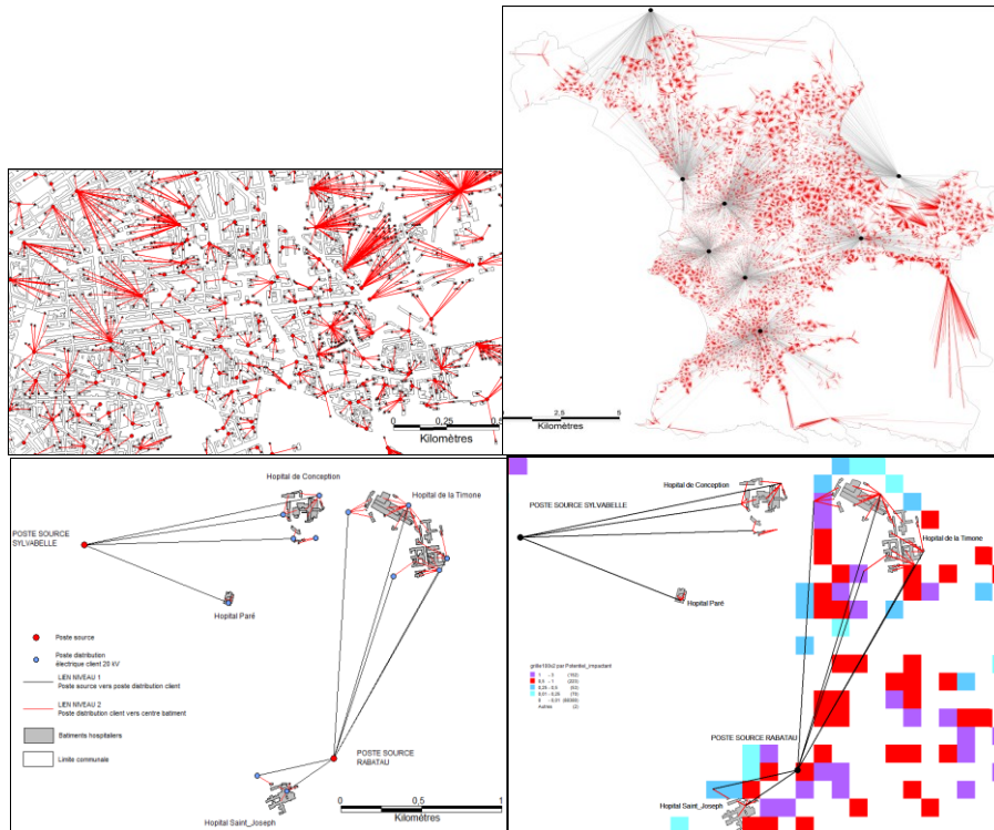
Figure II. a. Raccordement des nœuds du réseau électrique de distribution publique aux centroides des bâtiments résidentiels de la commune de Marseille b. Croisement susceptibilité (partie 1) avec alimentation électrique des hôpitaux